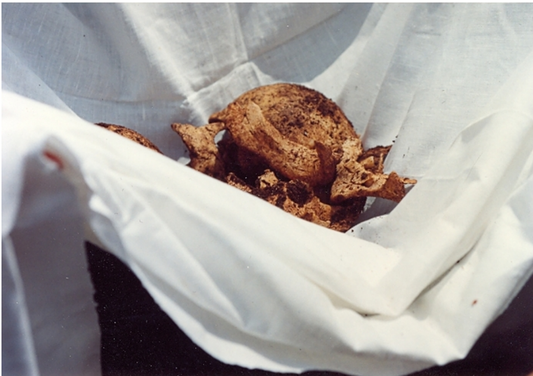
Από την ανακομιδή των Λειψάνων του Αγίου Ιωακείμ του Βατοπαιδινού του εξ Ιθάκης του επιλεγμένου Παπουλάκη

ευχαριστώντας τον Οσιο που την έσωσε απ'αυτήν την φοβερή παγίδα του διαβόλου.