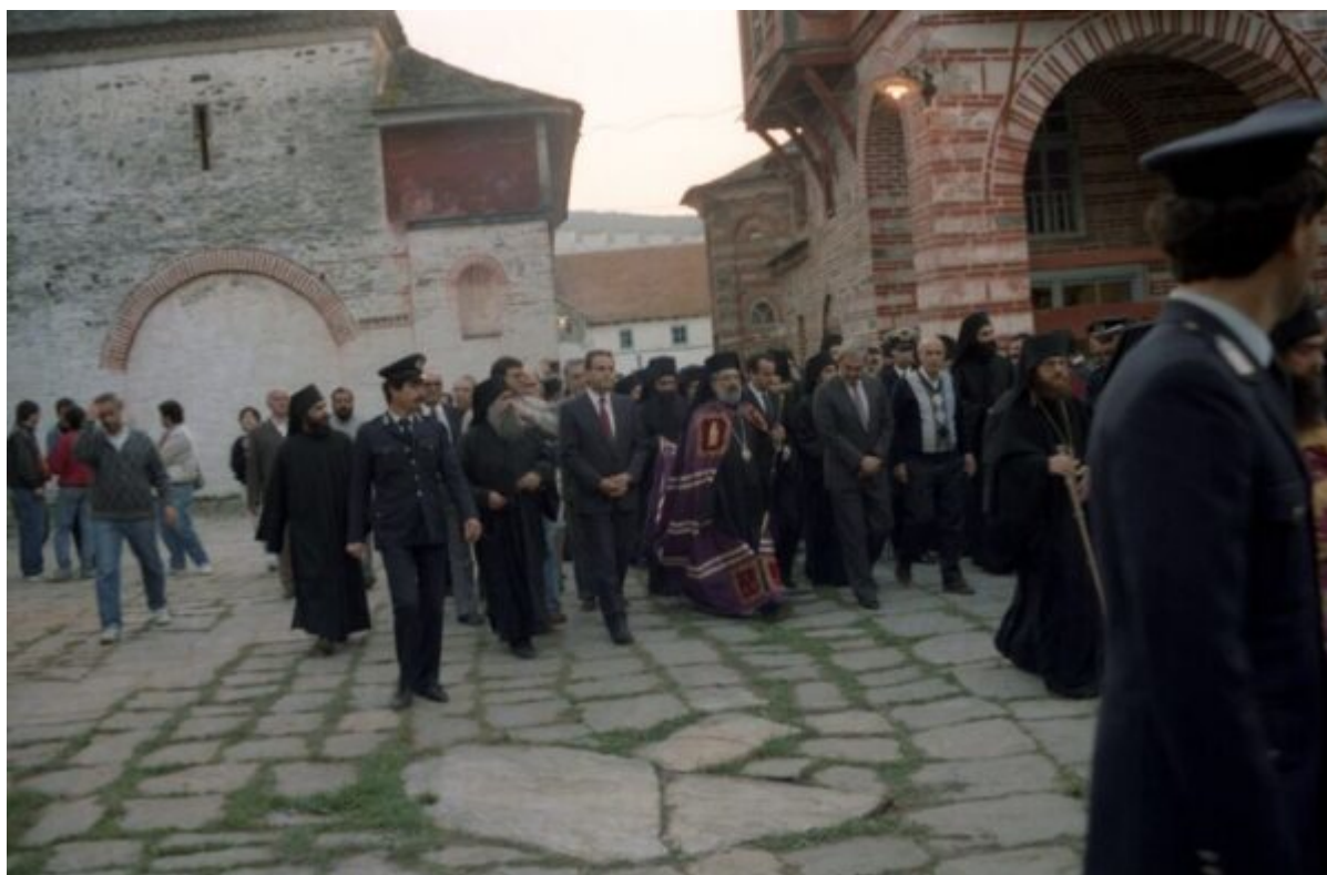
Υποδοχή των Εκπροσώπων της Ελληνική Πολιτείας Υπουργού Μακεδονίας Θράκης κ. Γεωργίου Τζίτζικώστα και Εσωτερικών κ. Σωτηρίου Κούβελα.