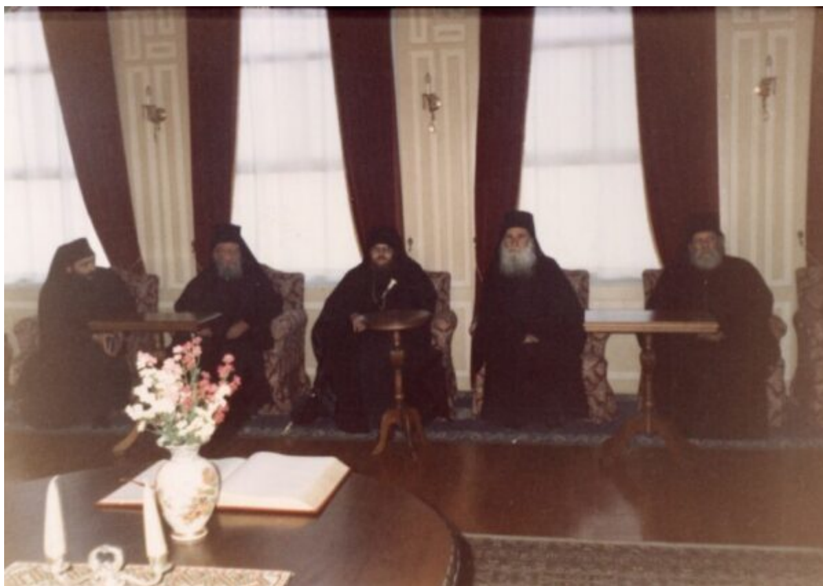
Μετά την επίσημη εκλογή του νέου Καθηγουμένου Γέροντος Εφραίμ Βατοπαιδινού.