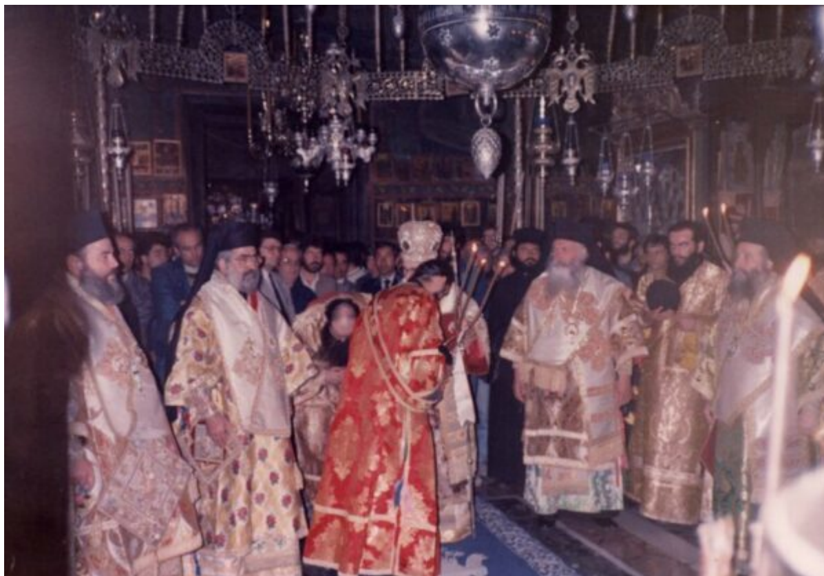
Από την Πολυαρχιερατική Θεία Λειτουργία κατά την ημέρα της ενθρονίσεως με προεξάρχοντα τον εκπρόσωπο του Οικουμενικού Θρόνου Μητροπολίτη Θεοδωρουπόλεως κ. Γερμανού (+).