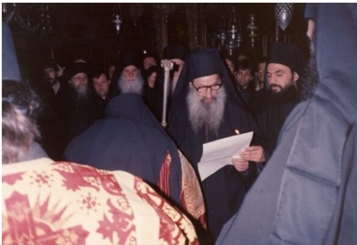
Παράδοση της ράβδου και ανάγνωση της αποφάσεως της κοινοβιοποιήσεως της Μονής.