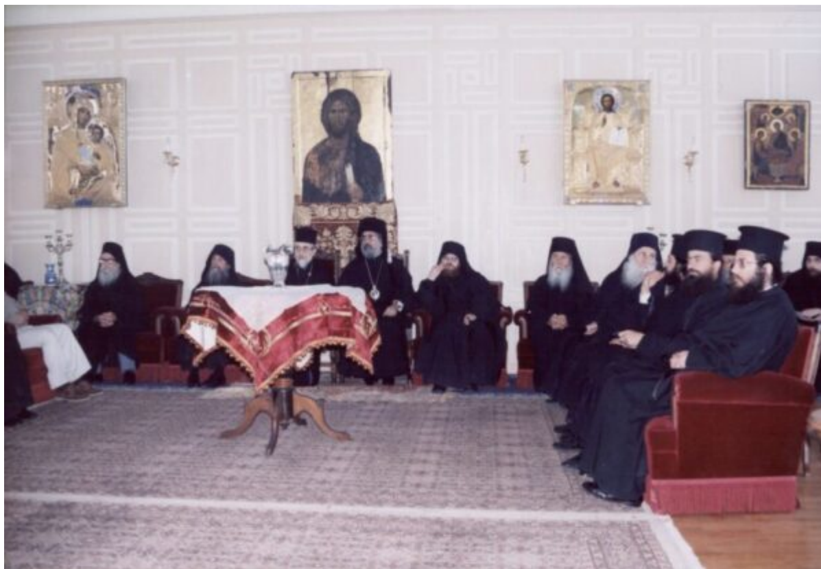
Ο εκπρόσωπος του Οικουμενικού Πατριάρχου Μητροπολίτης Θεοδωρουπόλεως κ. Γερμανός (2018) και Μητροπολίτης Κιτίου κ. Χρυσόστομος (νυν πρώην Κιτίου) στο Συνοδικό της Μονής μετά την υποδοχή.