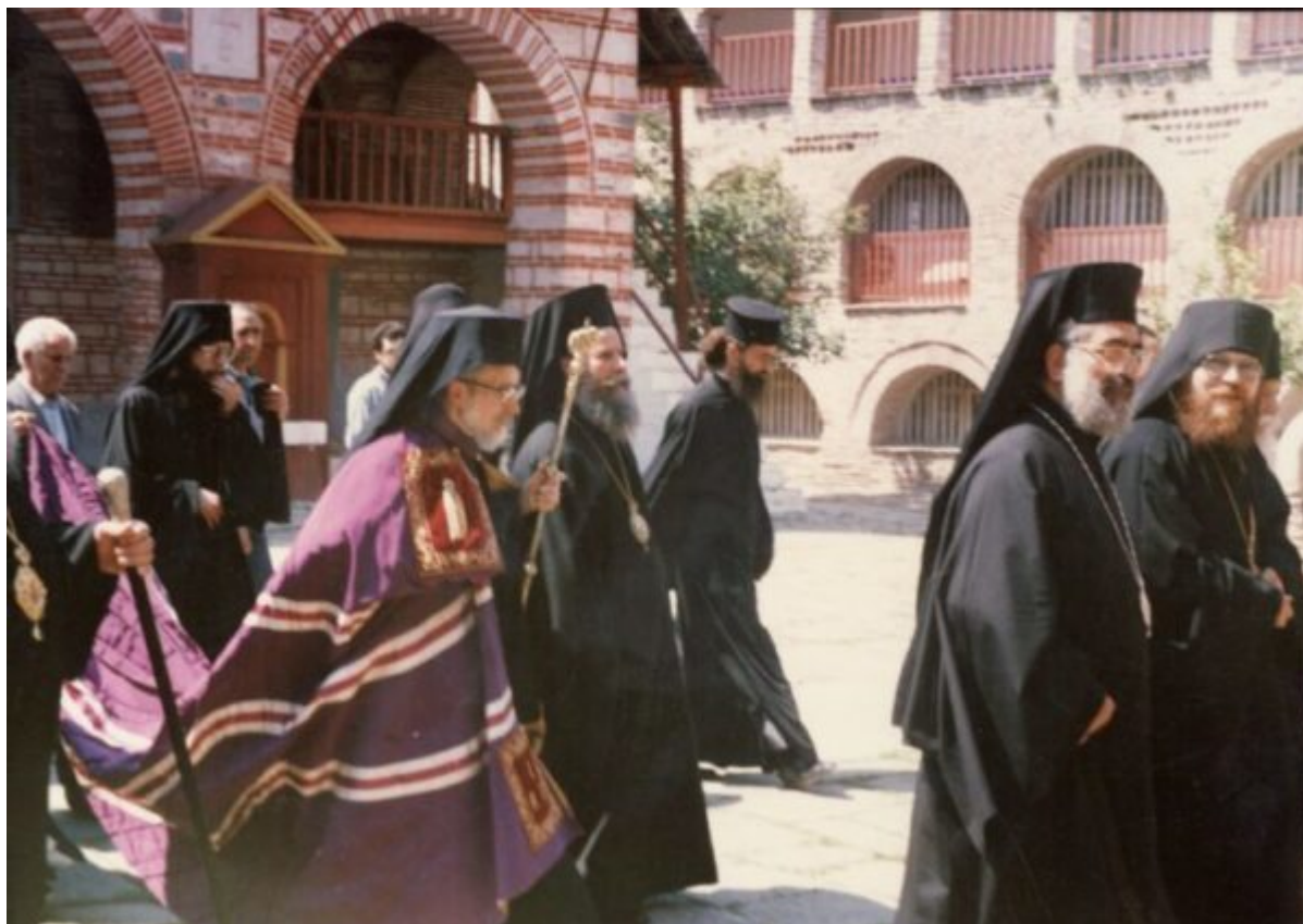
Υποδοχή του Μητροπολίτη Θεοδωρουπόλεως κ. Γερμανού (+) ως εκπροσώπου του Οικουμενικού Πατριάρχου.