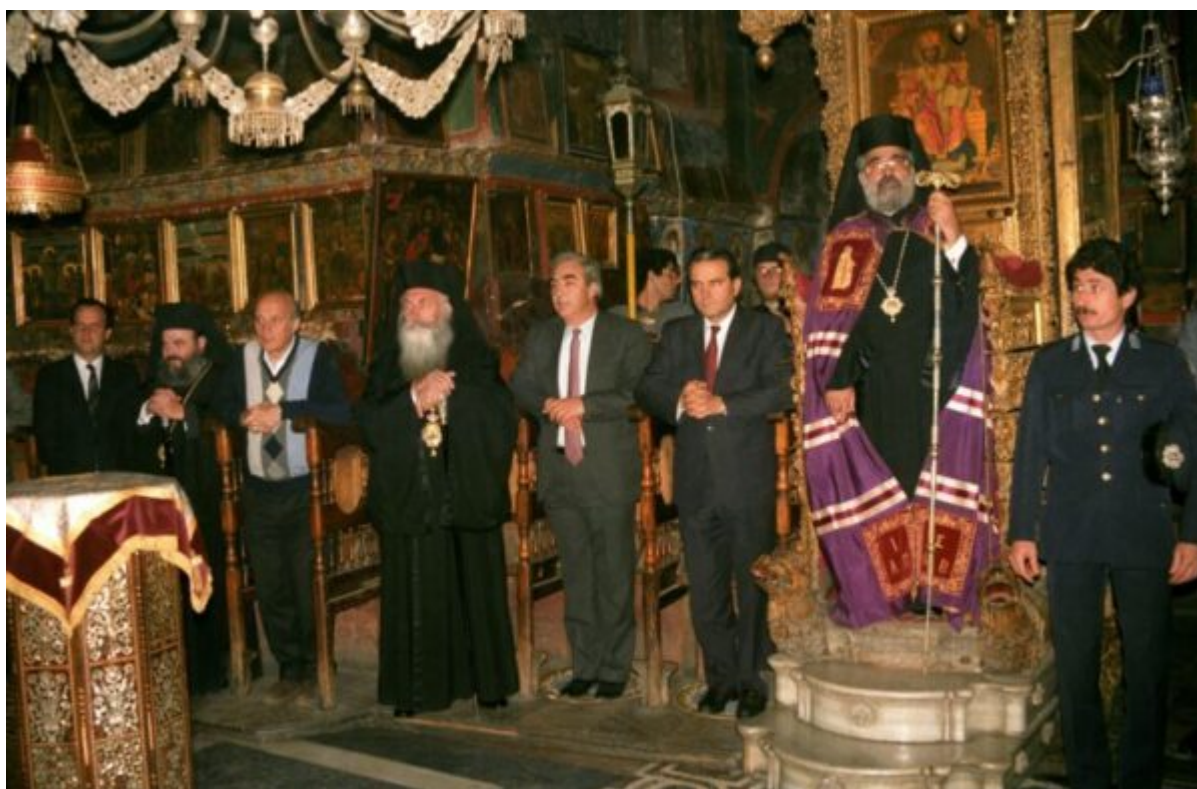
Από την υποδοχή των Εκπροσώπων της Ελληνική Πολιτείας Υπουργού Μακεδονίας Θράκης κ. Γεωργίου Τζίτζικώστα και Εσωτερικών κ. Σωτηρίου Κούβελα στο Καθολικό της Μονής.