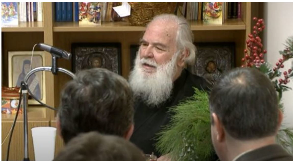
Φωτογραφίες από τα εγκαίνια των νέων γραφείων του συλλόγου το 2015