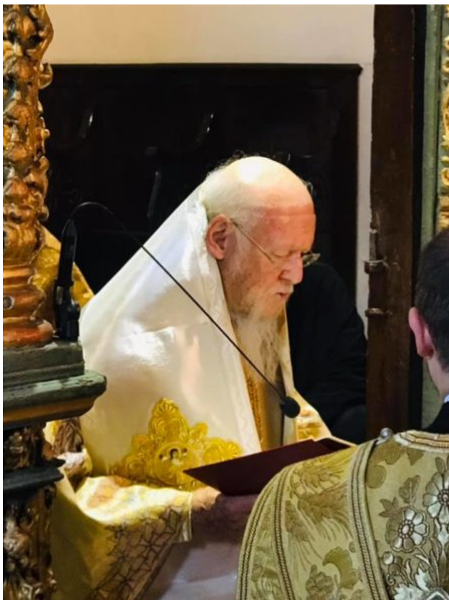
Κυριακή της Πεντηκοστής στο Οικουμενικό Πατριαρχείο, Φωτο: Nikos-Giorgos Parachristou / Ecumenical Patriarchate.