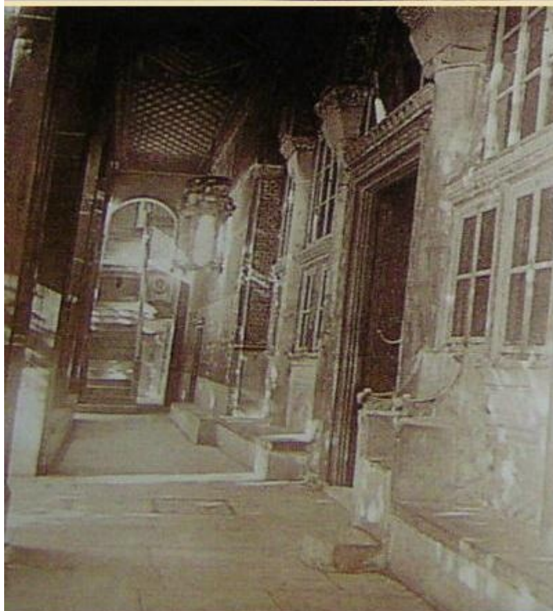
Φωτογραφίες: Fougères και Merle, 1903