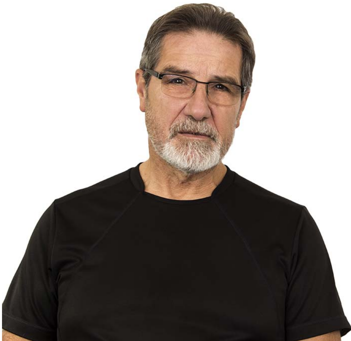
good looking old man

Ο προστάτης αδένας είναι ένα όργανο του άνδρα που βρίσκεται στη βάση της ουροδόχου κύστης και περιβάλλει το αρχικό τμήμα της ουρήθρας. Με την πάροδο της ηλικίας υπερτρέφεται και δημιουργεί προβλήματα στην ομαλή έξοδο των ούρων από την κύστη.