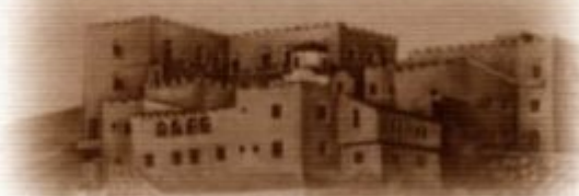
ΙΕΡΑ ΜΟΝΗ ΕΥΑΓΓΕΛΙΣΜΟΥ Μ.Η. ΠΑΤΜΟΣ

Όπως αναφέρει στον πρόλογο του βιβλίου της για τον γέροντα η Καθηγουμένη της Ιεράς Μονής Ευαγγελισμού Μητρός Ηγαπημένου, Μοναχή Χριστονύμφη: «Το νησί της Πάτμου, που ο Κύριος αγίασε με την Αποκάλυψή Του και δόξασε ο μεγάλος εξόριστος Άγιος Ιωάννης ο Θεολόγος, ανέδειξε στις ημέρες μας τον νέο Άγιο της διπλής αγάπης.