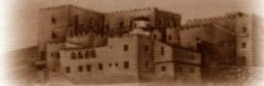
ΙΕΡΑ ΜΟΝΗ ΕΥΑΓΓΕΛΙΣΜΟΥ Μ.Η. ΠΑΤΜΟΣ

Ὅπως αναφέρει στον πρόλογο του βιβλίου της για τον γέροντα η Καθηγουμένη της Ιεράς Μονῆς Ευαγγελισμοῦ Μητρόσ Ηγαπημένου, Μοναχή Χριστονύμφη: «Το νησί της Πάτμου, που ο Κύριος αγίασε με την Αποκάλυψή Του και δόξασε ο μέγας εξόριστος Ἅγιος Ιωάννης ο Θεολόγος, ανέδειξε στις ημέρες μας τον νέο Ἅγιο της διπλῆς ἀγάπης.