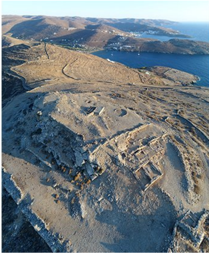
Η Νεκροπολη της Κύθνου από ψηλά

Τόσο η φύση των καταλοίπων όσο και τα λιγοστά ευρήματα επιτρέπουν να εικάσουμε ότι το Νότιο τμήμα της ακρόπολης προοριζόταν για ενδαιτήματα ίσως στρατιωτικού χαρακτήρα. Ανασκάφτηκαν εν μέρει δύο κτιριακά συγκροτήματα (Κτίρια 1 και 2) που φαίνεται ότι οικοδομήθηκαν στα πρώιμα αρχαϊκά χρόνια και παρέμειναν σε χρήση έως τουλάχιστον και την ελληνιστική περίοδο. Εδώ θα ήταν δυνατόν να αναζητηθεί και η έδρα της Μακεδονικής φρουράς που εγκατάστησε στην Κύθνο το 201 π.Χ. ο Φίλιππος Ε΄.