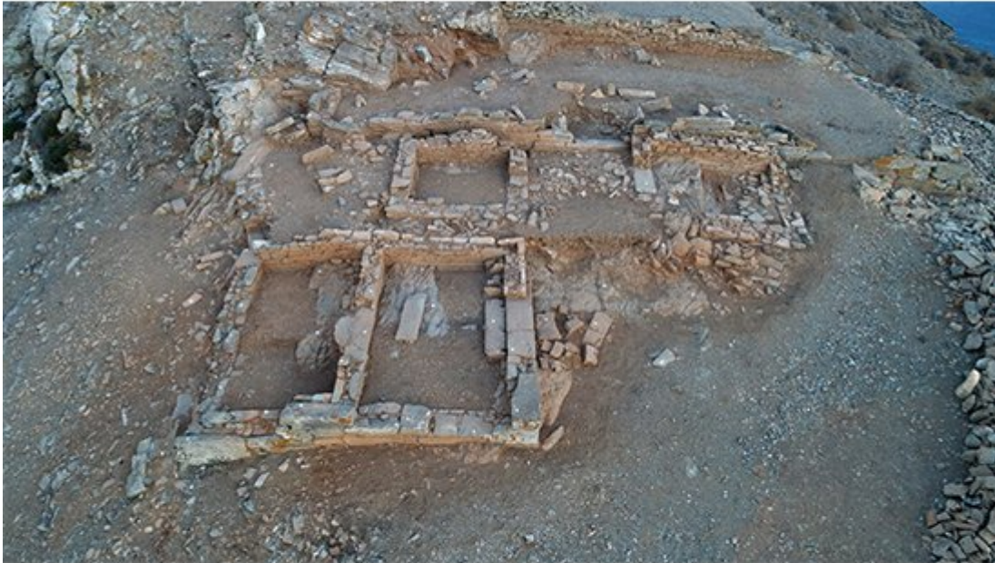
Το Ιερό που έφερε στο φως η ανασκαφή

(μαγειρικό σκεύος). Πολλά ακέραια ή σχεδόν ακέραια αναθήματα προέρχονται από τις επιχώσεις των δαπέδων και των δύο αιθουσών.