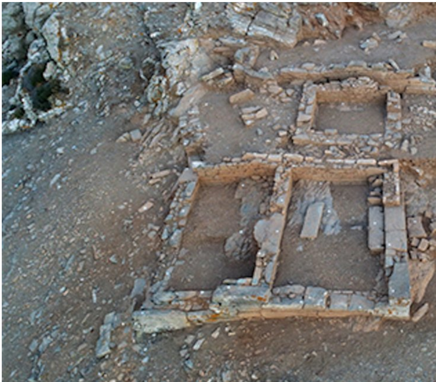
Η ανασκαφή στο Ιερό της Κύθνου απ

Η πρώτη περίοδος του νέου πενταετούς ανασκαφικού προγράμματος (2021-25) διήρκεσε έξι εβδομάδες, από 2 Ιουνίου έως 7 Αυγούστου. Η θέση ταυτίζεται με την αρχαία πόλη της Κύθνου που κατοικήθηκε αρχικά κατά την Πρωτοκυκλαδική περίοδο (3η χιλιετία) και στη συνέχεια ξανά αδιάκοπα από τον 12ο αιώνα π.Χ. έως τον 7ο αιώνα μ.Χ.. Οι φετινές εργασίες εστίασαν στην ανασκαφή ορισμένων κτιρίων της Ακρόπολης της αρχαίας πόλης. Προηγήθηκαν εκτεταμένοι καθαρισμοί από τη βλάστηση και απομάκρυνση διάσπαρτων λίθων που επέτρεψαν να αναγνωρισθούν πολυάριθμα αρχιτεκτονικά κατάλοιπα.