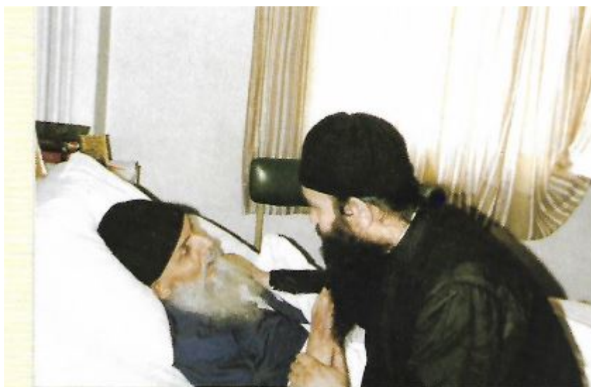
Ο Μητροπολίτης Καλλίνικος στο Νοσοκομείο Κληρικών Ελλάδος, λίγες μέρες πριν την κοίμηση του, με τον τότε Αρχιμανδρίτη και νυν Μητροπολίτη Ναυπάκτου & Αγίου Βλασίου κ. Ιερόθεο, 1984.