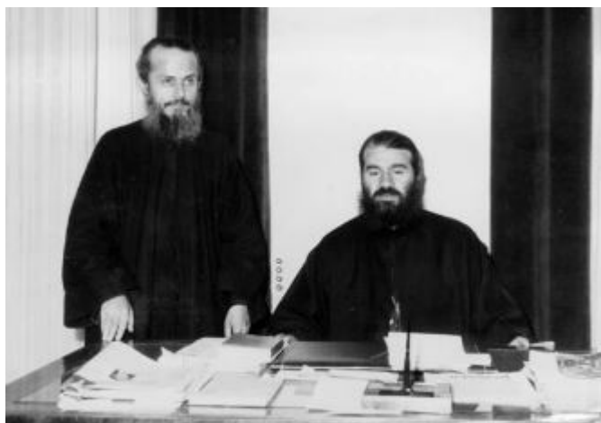
Ο Αρχιμανδρίτης - Πρωτοσύγκελος Καλλίνικος στο γραφείο του Μητροπολίτη Αιτωλίας & Ακαρνανίας Θεοκλήτου