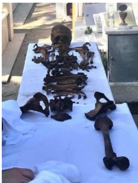
Τα ιερά λείψανα του Αγίου Καλλινίκου