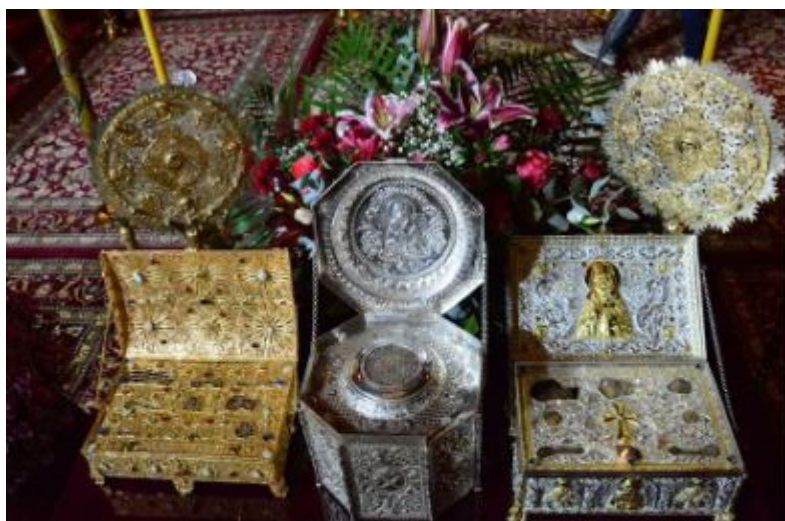
Τα ιερά λείψανα του Αγίου Καλλινίκου