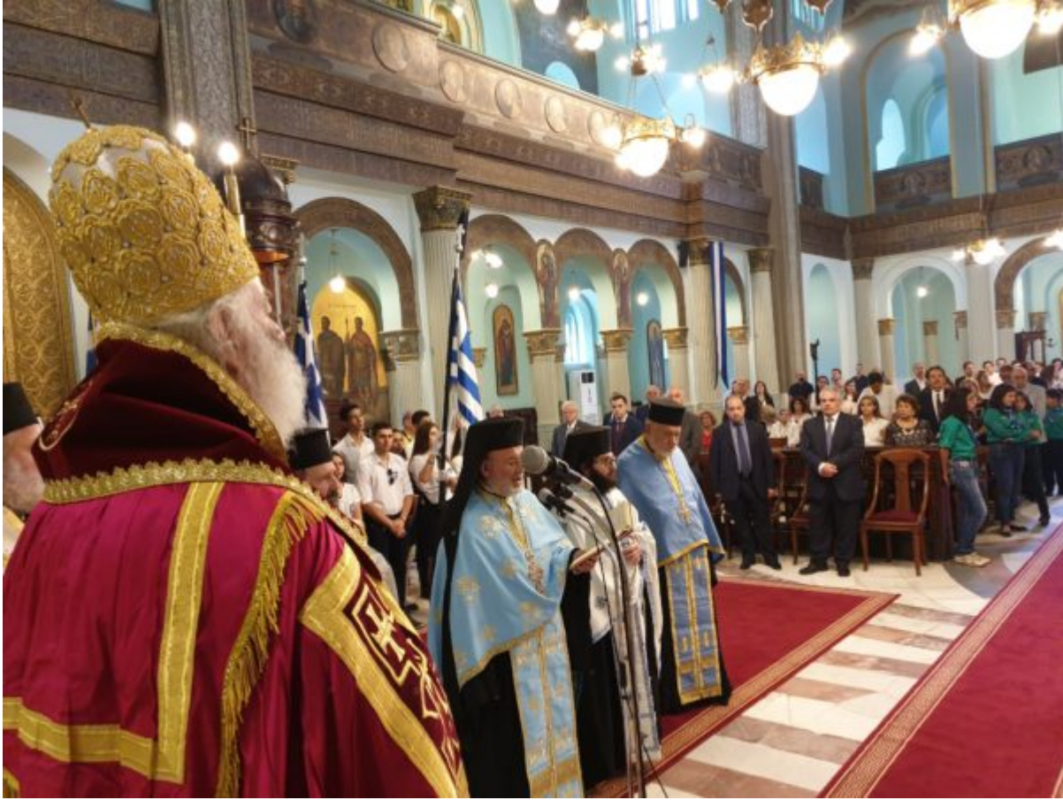
Ο Πατριάρχης Αλεξανδρείας Θεόδωρος στον Ι.Ν των Αγίων Κωνσταντίνου και Ελένης στο Κάιρο.

Ο ναός παρουσίασε εκτεταμένες ζημιές από τα θεμέλιά του λόγω της ανερχόμενης υγρασίας από το Νείλο και αποκαταστάθηκε με δαπάνη της Ελληνικής Κοινότητας Καΐρου και της Αικ. Μπελεφάντη Σοφιανού η οποία έχει τιμηθεί με το οφίκιο της Αρχόντισσας από τον Πατριάρχη Αλεξανδρείας . Επίσης, συντηρήθηκαν οι τοιχογραφίες και εξωραΐσθηκε ο περιβάλλοντας χώρος. Τα θυρανοίξιά του έγιναν στις 28 Σεπτεμβρίου 2019 από τον Πάπα και Πατριάρχη Αλεξανδρείας και Πάσης Αφρικής κ.κ. Θεόδωρο Β΄ και μεταδόθηκαν σε δορυφορική σύνδεση μέσω της ΕΡΤ σε όλο τον κόσμο.