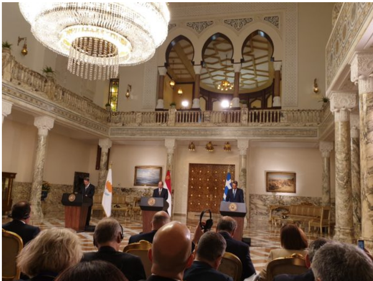
Κοινές δηλώσεις Αναστασιάδη, Αλ Σίσι, Μητσοτάκη το 2019 στην τριμερή που πραγματοποιήθηκε στο Προεδρικό Μέγαρο της Αιγύπτου.

Εκεί βρίσκεται και το ιστορικό ξενοδοχείο Heliopolis Palace Hotel το οποίο τη δεκαετία του '20 φιλοξένησε βασιλείς, την «αφρόκρεμα» της αριστοκρατίας και των επιχειρηματιών από Ευρώπη και Αμερική . Στη συνέχεια μετατράπηκε στην κατοικία του τέως προέδρου Μπουμπάρακ. Σήμερα λειτουργεί ως Προεδρικό Μέγαρο και όχι ως προεδρική κατοικία. Σε απόσταση αναπνοής βρίσκονται τα Ελληνικά Σχολεία του Καΐρου , τα οποία στεγάζονται στο Σπετσεροπούλειο Ορφανοτροφείο .