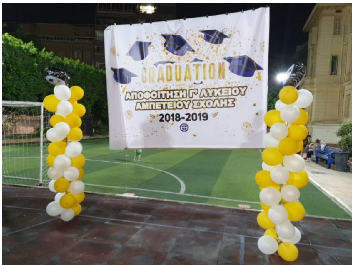
Στιγμιότυπο από την αποφοίτηση της Γ τάξης Λυκείου της Αμπετείου.

Οι απόφοιτοί του έχουν το δικό τους Σύλλογο Αποφοίτων Αμπετείου Σχολής . Πλέον στο εμβληματικό κτήριο του Σπετσεροπουλείου στεγάζονται όλα τα Ελληνικά Σχολεία παράλληλα είναι και σημείο συνάντησης του Ελληνισμού του Καΐρου .