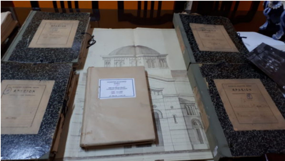
Τα σχέδια του Αγ. Κωνσταντίνου.

Λίγα μέτρα πιο κάτω στην Ελληνική πολυκατοικία της οδού Soliman El Halaby , βρίσκεται το Μεταφραστικό Τμήμα και το Αρχείο της Ελληνικής Κοινότητας .