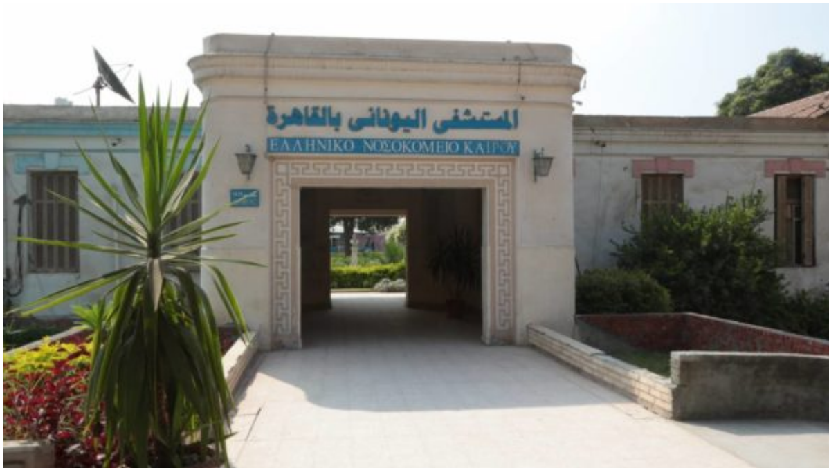
Εικόνα από το Ελληνικό Νοσοκομείο Καΐρου.