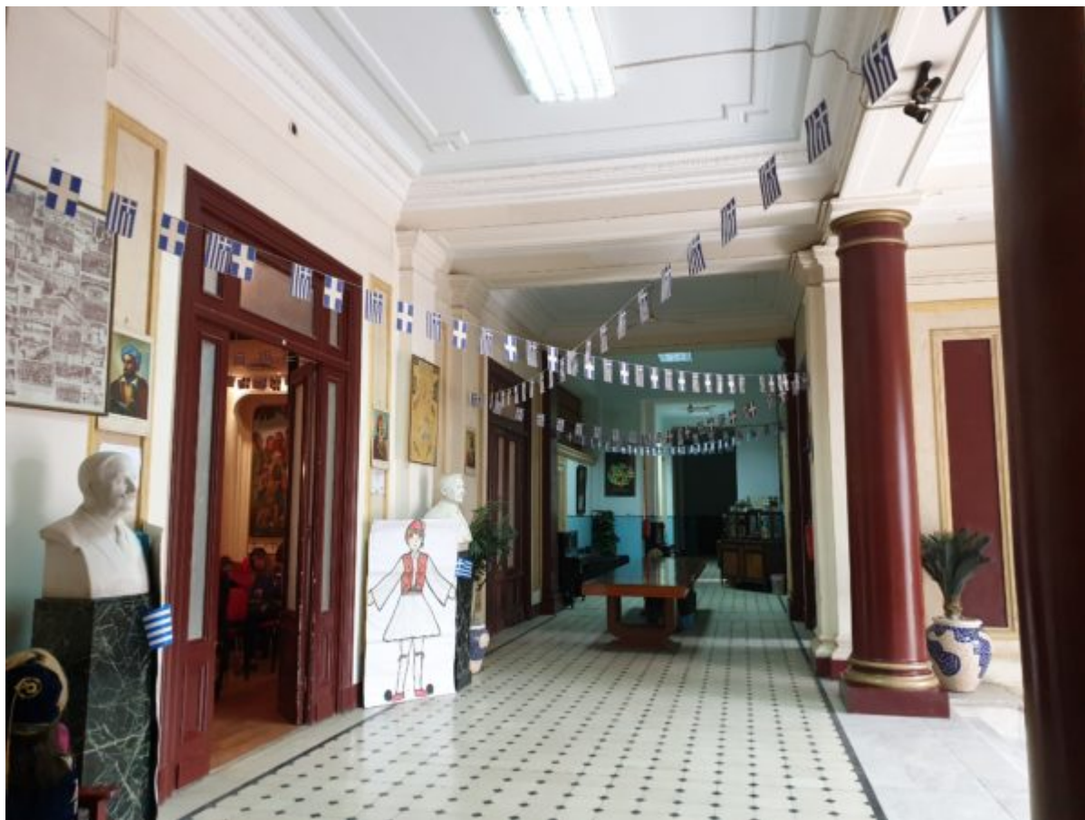
Το εσωτερικό του Σπετσεροπούλειου. Αριστερά το αμφιθέατρο όπου γίνονται οι εκδηλώσεις των μαθητών της Αχιλλοπουλείου.

Πρόκειται για ένα εντυπωσιακό νεοκλασικό κτήριο με μοναδικής αισθητικής διάκοσμο. Δίπλα ακριβώς βρίσκεται το εκκλησάκι των Εισοδίων της Θεοτόκου , του οποίου το τέμπλο έχει φιλοτεχνήσει ο Φώτης Κόντογλου στην πρώτη περίοδο της δημιουργίας του.