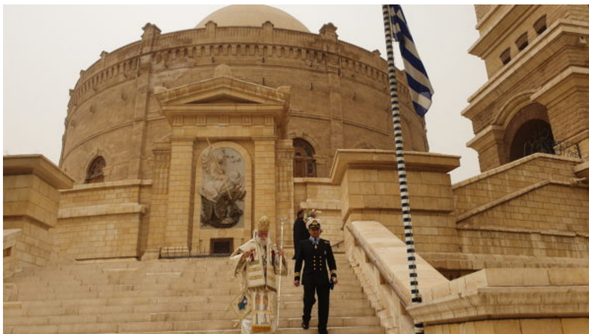
Ο Πατριάρχης Αλεξανδρείας και Πάσης Αφρικής κ.κ. Θεόδωρος Β' στην Ι.Μ Αγίου Γεωργίου στο Κάιρο.

Στο χώρο της Μονής βρίσκεται και το Ελληνικό κοιμητήριο, το μεγαλύτερο ελληνορθόδοξο νεκροταφείο της Αιγύπτου . Το μοναστήρι αποτελεί προσκύνημα και για τους μουσουλμάνους και είναι γνωστό ως Mar Girgis . Στις κατακόμβες της Μονής του Αγίου Γεωργίου λειτουργεί ακόμη το παρεκκλήσι των Αγίων Τεσσαράκοντα Μαρτύρων και συνολικά άλλα 19 παρεκκλήσια.