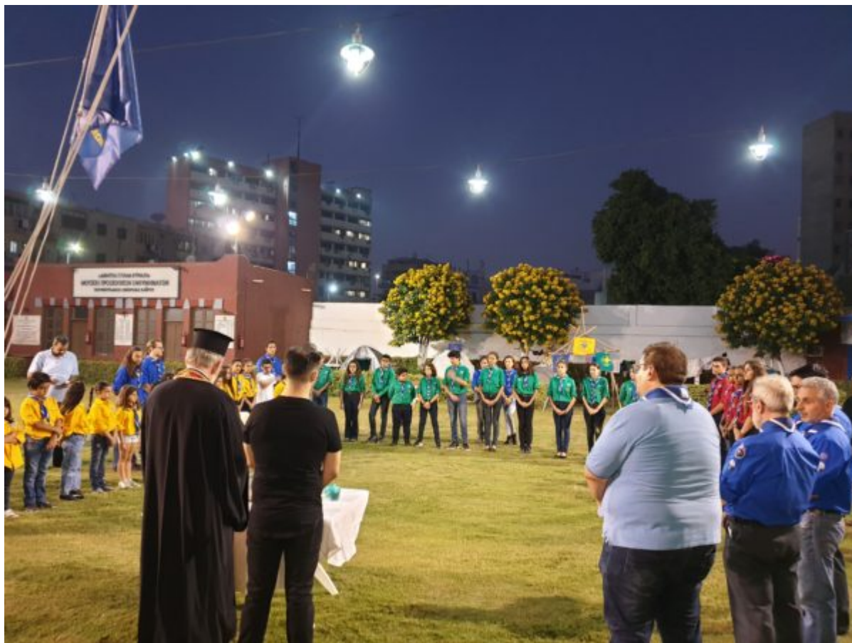
Εικόνα από δράση των Προσκόπων στο Κάιρο.

Με την μπάντα τους οι Πρόσκοποι υποδέχονται τον Προκαθήμενο του Δευτερόθρονου Πατριαρχείου στις επίσημες εκκλησιαστικές εκδηλώσεις και είναι παρόντες σε όλα τα μεγάλα γεγονότα και τις Εθνικές επετείους που γιορτάζουν οι Έλληνες του Καΐρου .