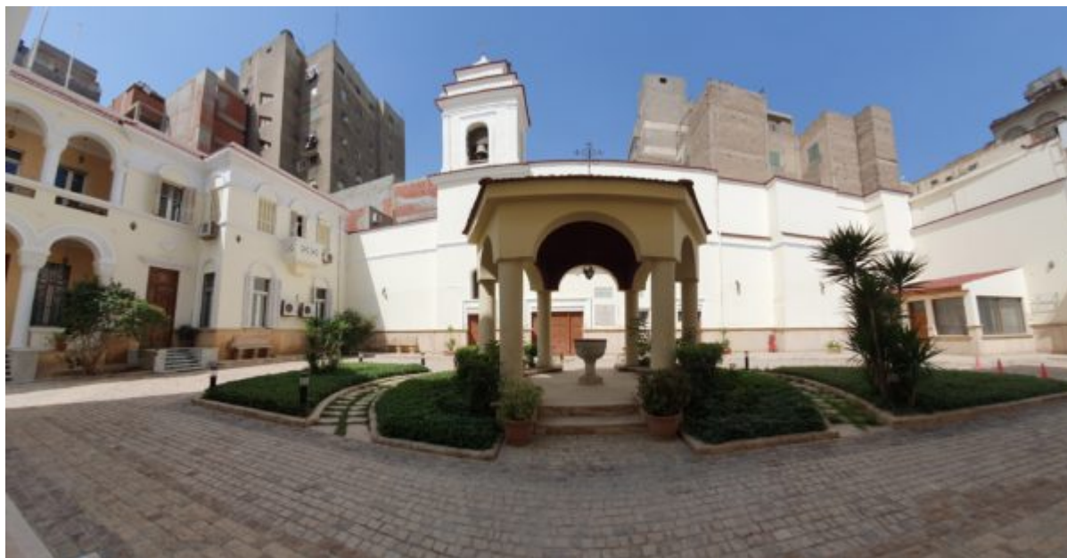
Η Πατριαρχική Επιτροπή στο Κάιρο όπως φαίνεται βγαίνοντας από το ναό του Αγίου Νικολάου. Αριστερά διακρίνονται τα γραφεία και απέναντι ο ναός του Αγίου Νεκταρίου, ακριβώς κάτω από το κελί του.

Η ροτόντα της Ανατολής είναι ο ναός της Μονής του Αγίου Γεωργίου στο μεσαιωνικό Κάιρο. Το Μοναστήρι χρονολογείται από τον 12ο αιώνα μ.Χ και χτίσθηκε στα παλιά τείχη της Βαβυλώνας της Αιγύπτου . Ο ναός ανοικοδομήθηκε μετά από εκτεταμένες ζημιές, το 1909 από τον Πατριάρχη Φώτιο . Πρόσφατα ανακαινίσθηκε με δαπάνη του Αθανάσιου Μαρτίνου εφοπλιστή νυν πολιτικού διοικητή του Αγίου Όρους .