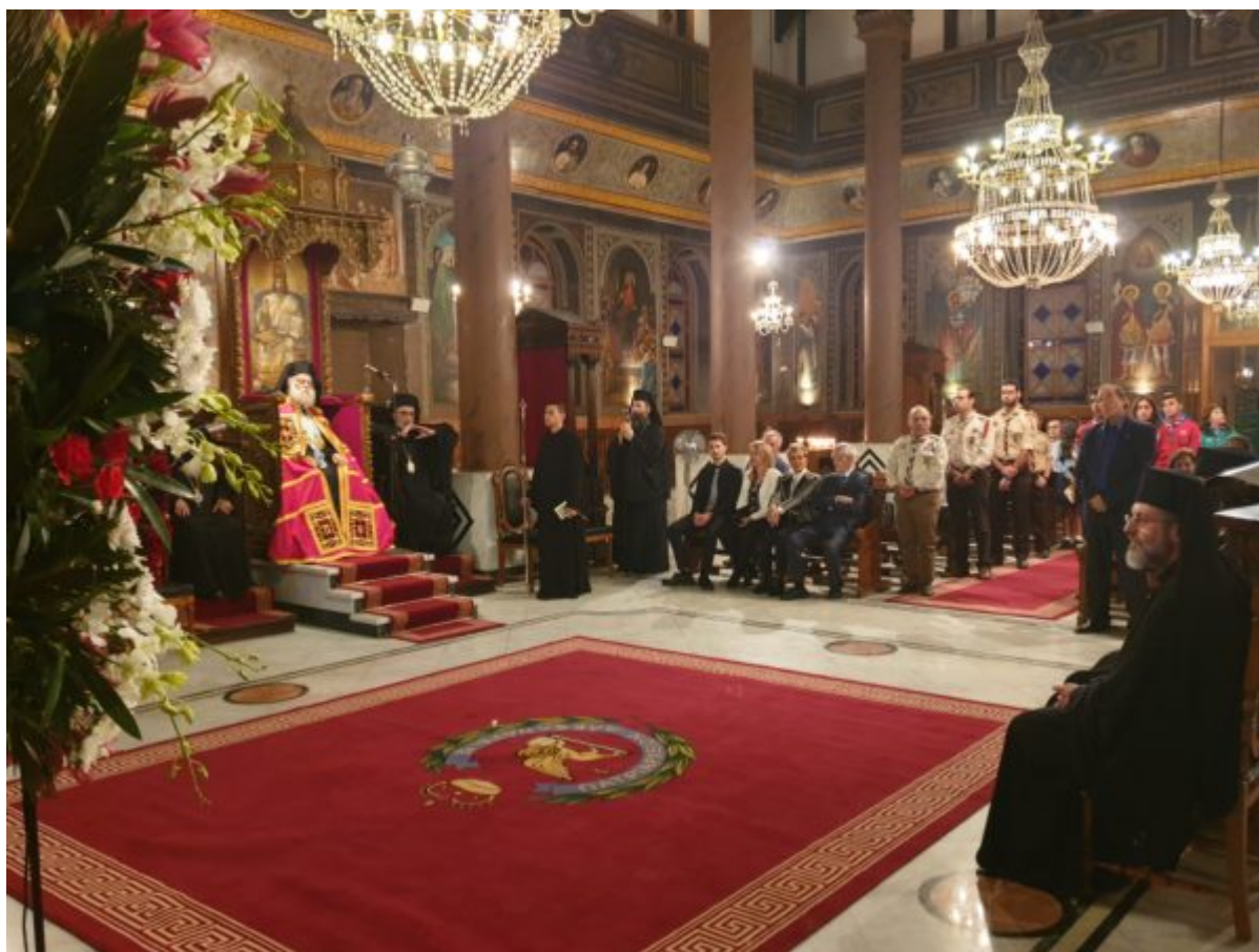
Ο Πάπας και Πατριάρχης Αλεξανδρείας και Πάσης Αφρικής κ.κ. Θεόδωρος Β΄ στον Άγιο Νικόλαο, τον καθεδρικό ναό της Πατριαρχικής Επιτροπείας Καΐρου.

Χρονολογείται από τον 14ο αιώνα και είναι ο παλιότερος Ορθόδοξος ναός στο Κάιρο . Είναι η έδρα του Πατριαρχείου στην Αιγυπτιακή Πρωτεύουσα και φιλοξενεί τα μεγάλα γεγονότα του Ελληνισμού και του Πατριαρχείου . Στο ίδιο συγκρότημα βρίσκεται το κελλί του Αγίου Νεκταρίου (ο οποίος χειροτονήθηκε Επίσκοπος Πενταπόλεως στον ίδιο ναό).