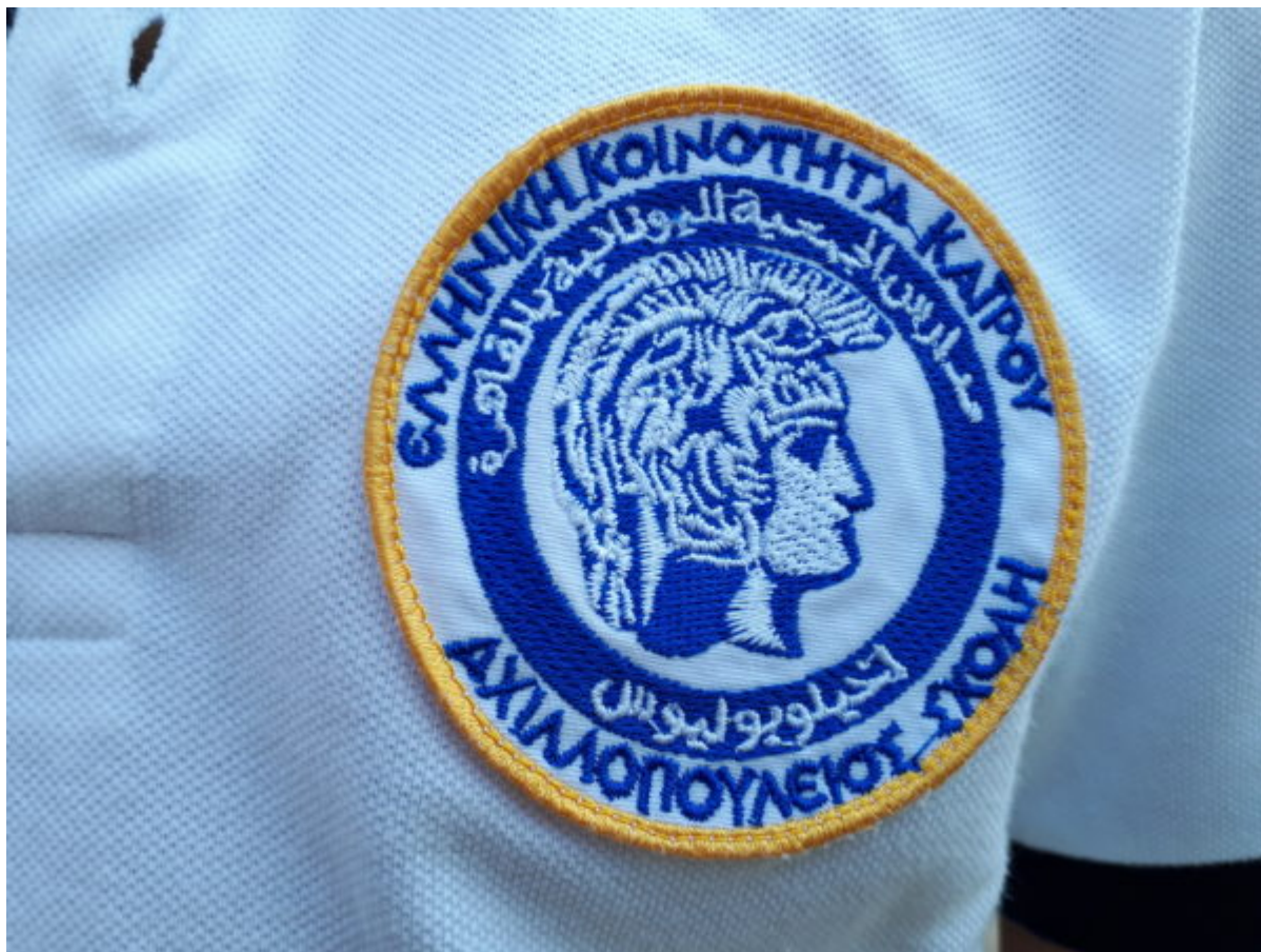
Μαθήτρια της Αχιλλοπούλειου φορά μπλούζα με το έμβλημα της Σχολής.

Σε σύντομο διάστημα μεταφέρεται στο κτίριο του Σπετσεροπούλειου Ορφανοτροφείου στην Ηλιούπολη .