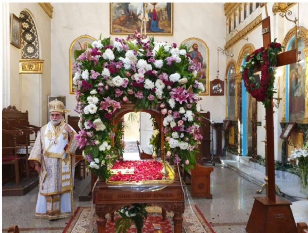
Η Παναγίτσα στην Ηλιούπολη του Καΐρου. Η Ακολουθία του Επιταφίου εν μέσω covid-19

Η Παναγίτσα, ο ναός της Υπεραγίας Θεοτόκου στην πλατεία Salah el Din της Ηλιούπολης , ιδρύθηκε το 1925 από τον Πατριάρχη Φώτιο . Σήμερα είναι η έδρα του Μητροπολίτη Μέμφιδος και Πατριαρχικού Επιτρόπου Καΐρου .