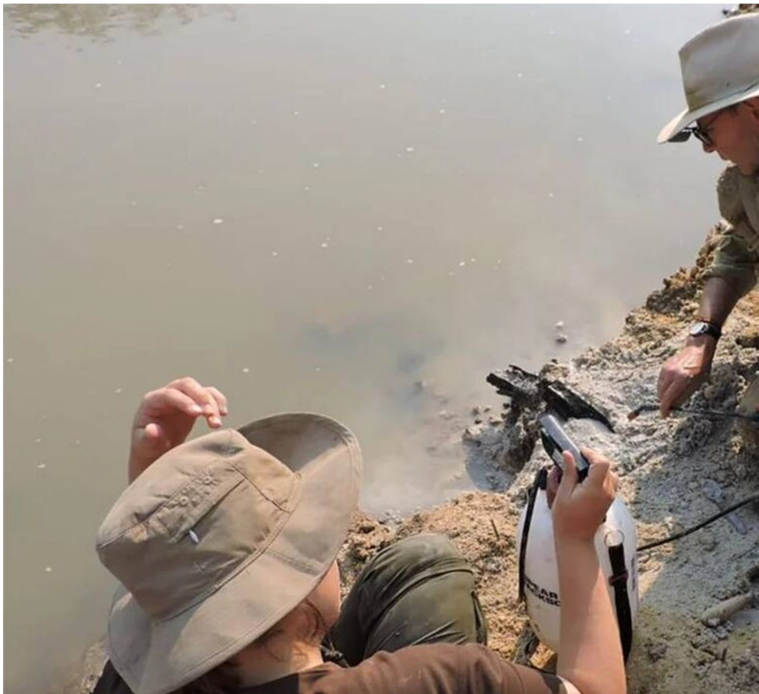
Αποκαλύπτοντας την ξύλινη κατασκευή στις όχθες του ποταμού.

Σύμφωνα με τη μελέτη, ξύλινη κατασκευή σαν αυτή δεν έχει καταγραφεί ξανά στα αρχαιολογικά αρχεία. Το αρχαιότερο γνωστό ξύλινο τεχνούργημα είναι ένα θραύσμα γυαλισμένης σανίδας ηλικίας 780.000 ετών που βρέθηκε στο Ισραήλ, ενώ τα αρχαιότερα ξύλινα εργαλεία για κυνήγι που έχουν καταγραφεί, ανακαλύφθηκαν στην Ευρώπη και χρονολογούνται πριν από περίπου 400.000 χρόνια.