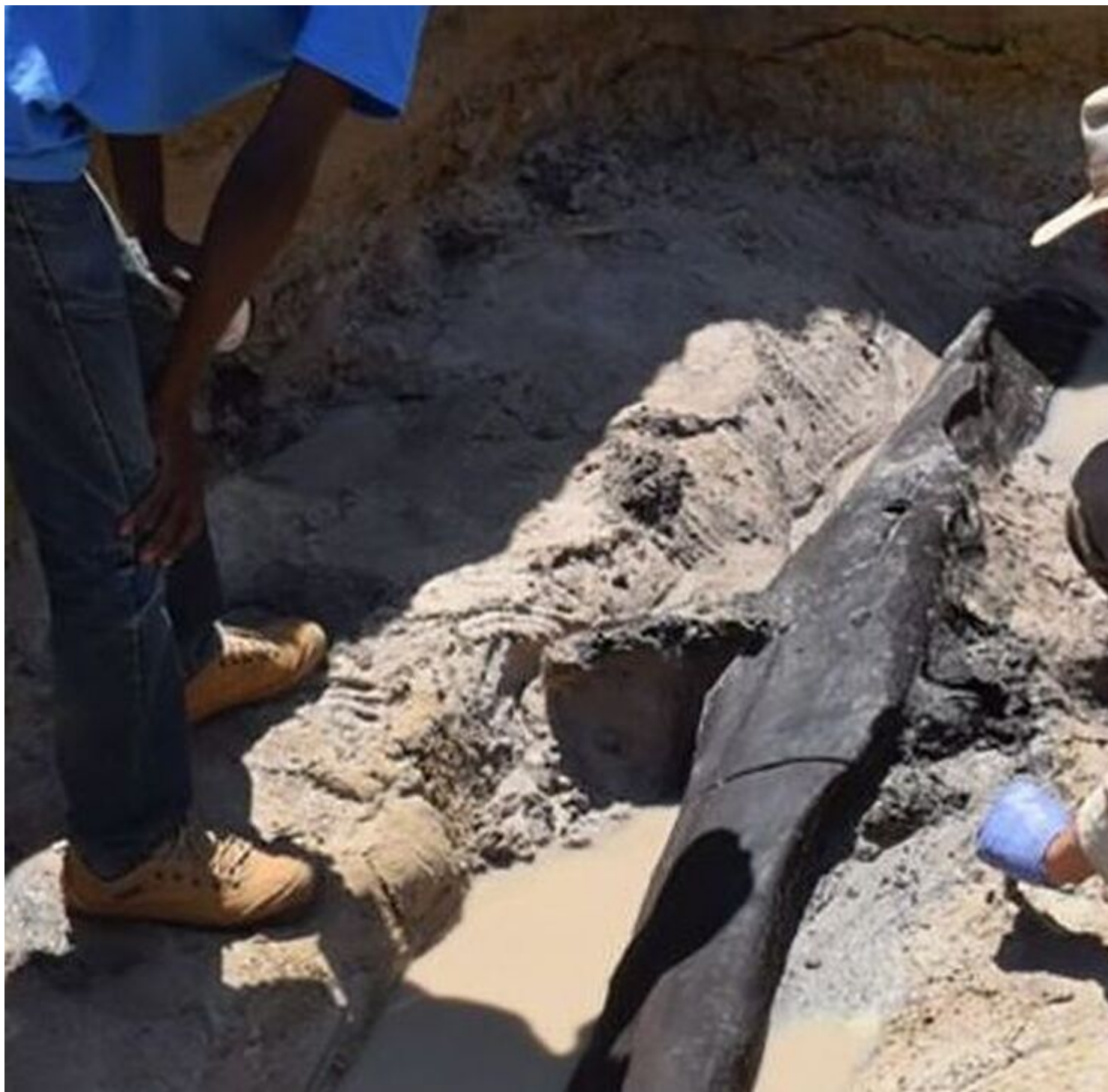
Η ανακάλυψη της ξύλινης κατασκευής αλλάζει την άποψη για το τι ήταν ικανοί οι άνθρωποι να κατασκευάσουν.

Η απλή κατασκευή - που βρέθηκε κατά μήκος μιας όχθης ποταμού στη Ζάμπια - αποτελείται από δύο ενωμένους κορμούς δέντρων, με μια εγκοπή που δημιουργήθηκε σκόπιμα στον πάνω κορμό με λίθινα εργαλεία, για να τους επιτρέψει να ταιριάζουν μεταξύ τους σε ορθή γωνία, σύμφωνα με νέα μελέτη.