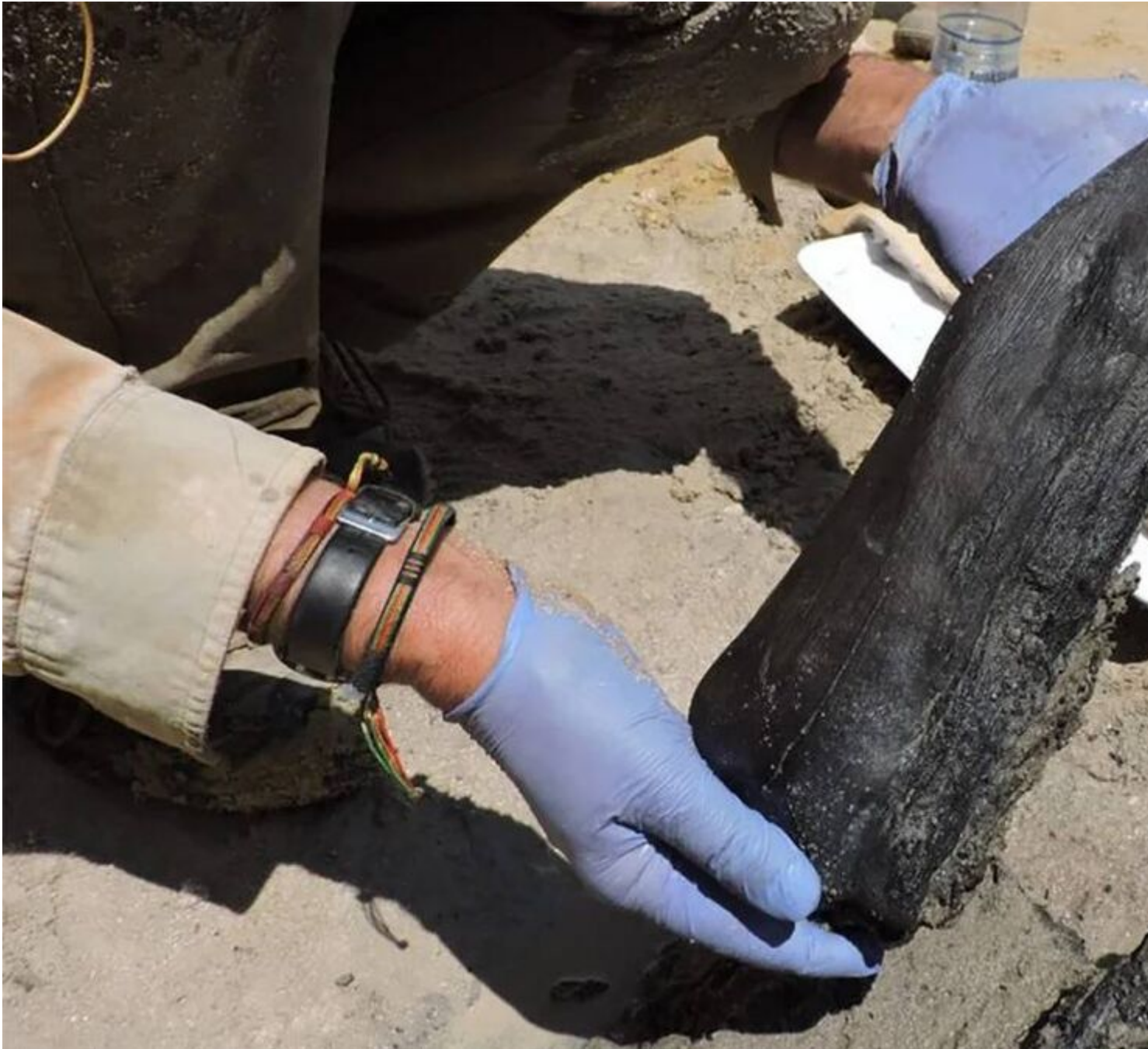
Ένα από τα ξύλινα εργαλεία που βρέθηκαν στην π...

Αυτή η μέθοδος χρονολόγησε την κατασκευή στα 476.000 χρόνια και τα τέσσερα ξύλινα εργαλεία - μια σφήνα, ένα ξύλο σκαψίματος, έναν κομμένο κορμό και ένα κλαδί με εγκοπές - στα 324.000 χρόνια.