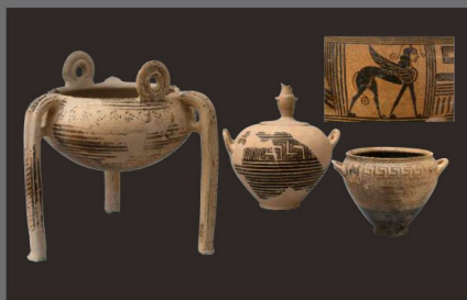
Αρχαιολογικό Μουσείο Αγίου