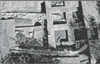
Νικολαίικα (Αρχαία Ελίκη)

Με τη χρηματοδότηση της Ευρωπαϊκής Ένωσης NextGenerationEU