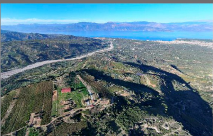
Κούμαρη Αγίου (Αρχαίες Ρύτες)