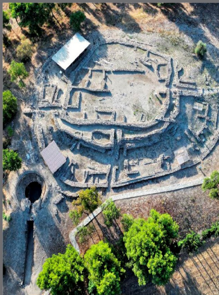
Διμήνη Ιωλκός, Μαγνησία

Με τη χρηματοδότηση της Ευρωπαϊκής Ένωσης NextGenerationEU