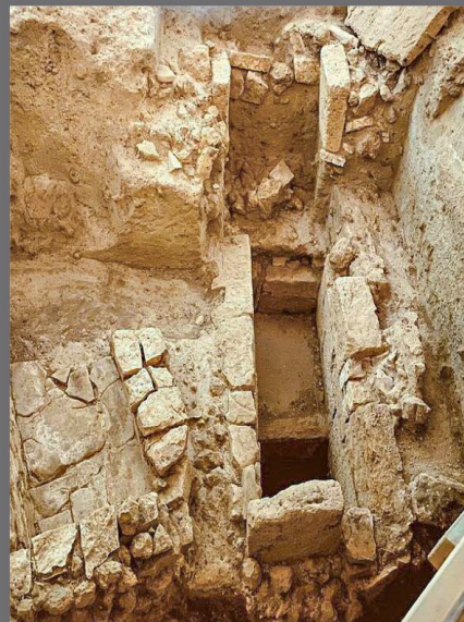
Θολωτός τάφος Τζανατών, Κεφαλονιά

ΜΝΗΜΕΙΑΚΑ ΕΡΓΑ ΚΥΚΛΩΠΩΝ ΚΑΙ ΑΝΘΡΩΠΩΝ ΚΑΤΑ ΤΗ ΜΥΚΗΝΑΪΚΗ ΠΕΡΙΟΔΟ (2η ΧΙΛΙΑΤΙΑ π.Χ.)