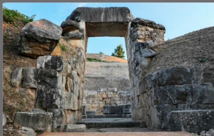
Θολωτός τάφος "Μινύα", Ορχομενός Βοιωτίας