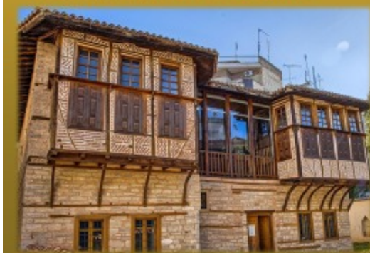
Κοζάνη, Αρχοντικό Βούρκα