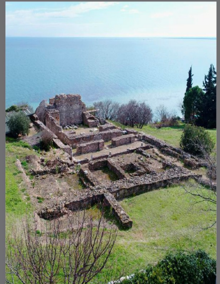
Πύδνα Επισκοπικό συγκρότημα