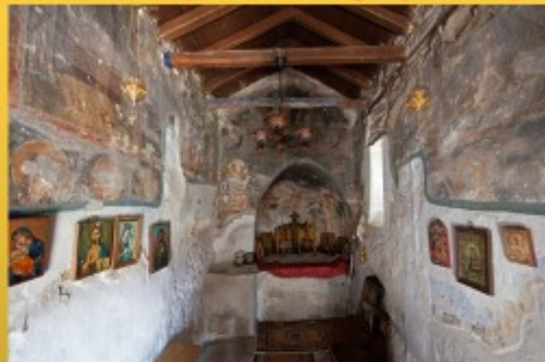
Βελβεντό, ναός Αγίου Μηνά