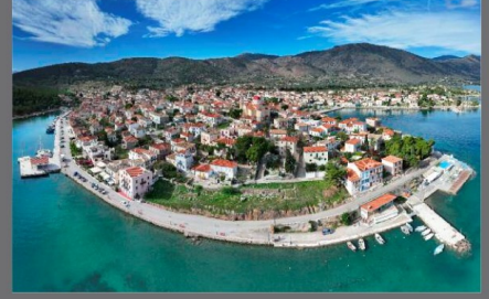
Γαλαξίδι (αρχαίο Χάλειον)