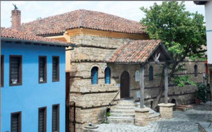
Βέροια Εβραϊκή Συναγωγή Βέροιας