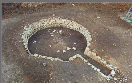
Θολωτός τάφος Χώνες Κατούνας, Αιτωλοακαρνανία