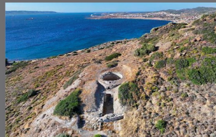
Θολωτός τάφος Θορικού, Λαυρεωτική