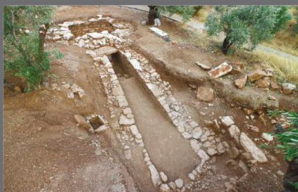
Θολωτός τάφος Άμπλιανου Άμφισσας, Φωκίδα