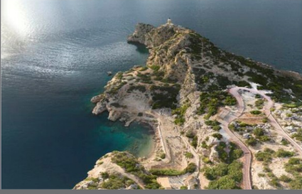
Ιερό της Ήρας στην Περαχώρα