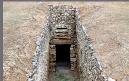
Θολωτός τάφος Αχαρνών, Αττική

ΜΝΗΜΕΙΑΚΑ ΕΡΓΑ ΚΥΚΛΩΠΩΝ ΚΑΙ ΑΝΘΡΩΠΩΝ ΚΑΤΑ ΤΗ ΜΥΚΗΝΑΪΚΗ ΠΕΡΙΟΔΟ (2η ΧΙΛΙΑΤΙΑ π.Χ.)