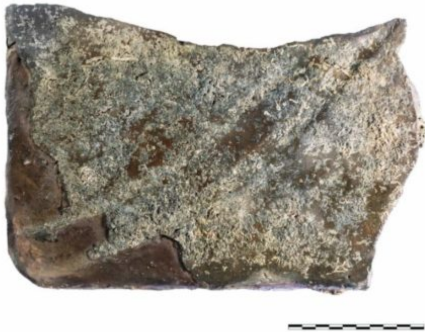
Η πύλην πλάκα μόνωσης, πιθανώς κοπίας.

αποτέλεσμα να αποσυντεθεί πλήρως και σχετικά γρήγορα.