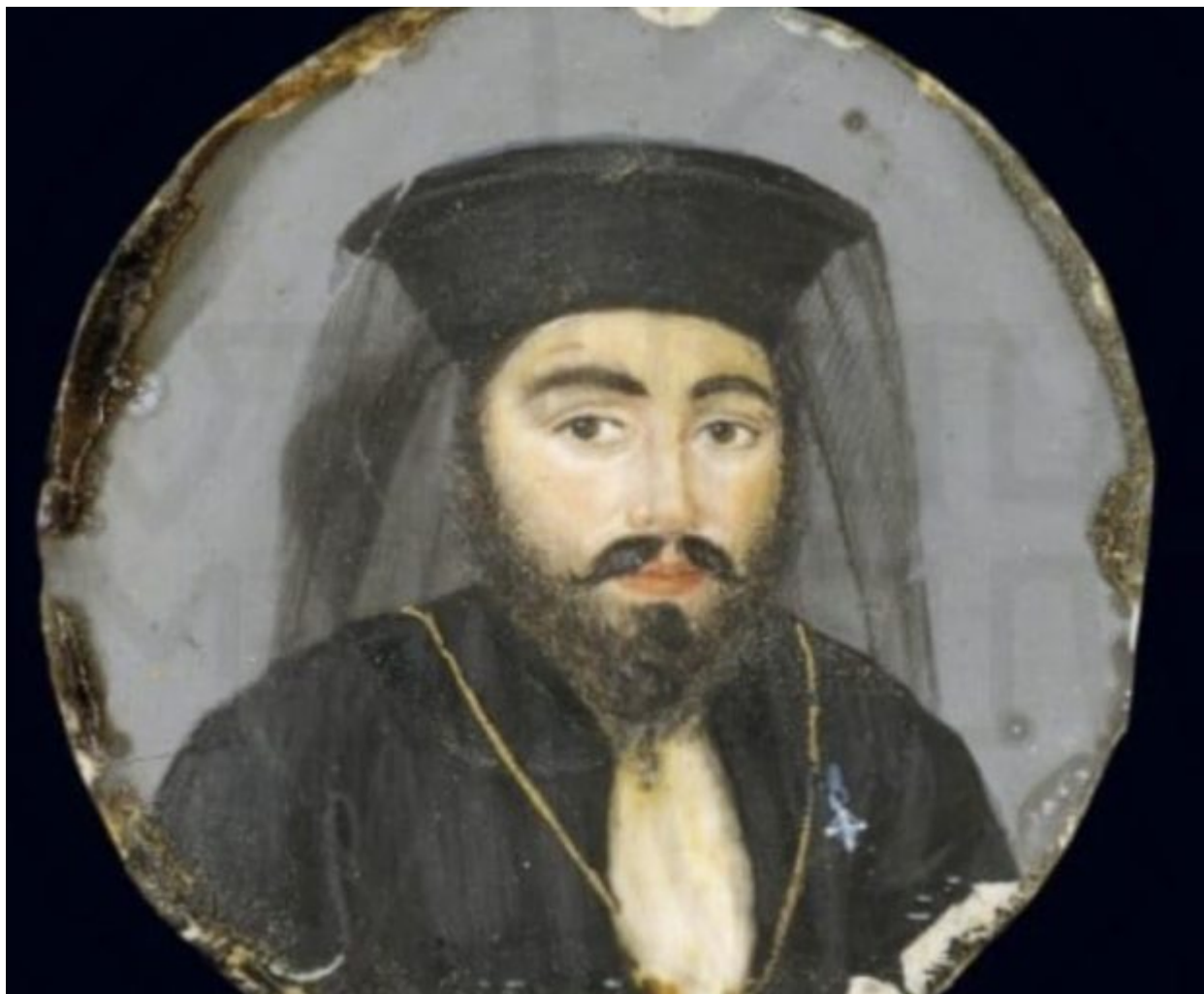
Ο αρχιμανδρίτης Θεόφιλος Θησεύς. Υδατογραφία, διάμ. 0,05 μ. (ΓΕ 8445). Μουσείο Μπενάκη.