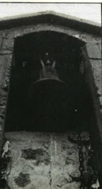
Το καμπαναριό της εκκλησίας του Άγ. Γιώργη.