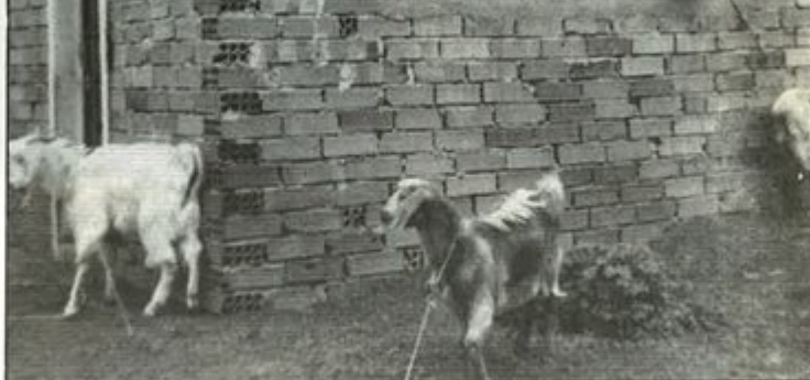
Οι «συγκάτοικοι» της κυρά - Ειρήνης.

Το χωριό ήταν μικρό και σχεδόν αυτόνομο. Οι δρόμοι ήταν καμωμένοι από πέτρα και κανενός είδους επικοινωνία δεν υπήρχε, εκτός από ένα ταχυδρομικό κιβώτιο Εγγλεζικού τύπου, και ακόμα σώζεται στην πλατεία. Τα υπομονετικά γαϊδουράκια ήταν τα