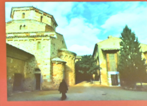
Μετόχι της Αγίας Σώτηρας στο Σολάν της Γαλλίας. Dependency of the Protection of the Mother of God, Solan, France.