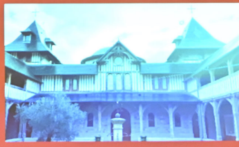
Μετόχι της Μεταμορφώσεως του Σωτήρος στην Τερασόν της Γαλλίας. Dependency of the Transfiguration of Christ, Terrason, France.