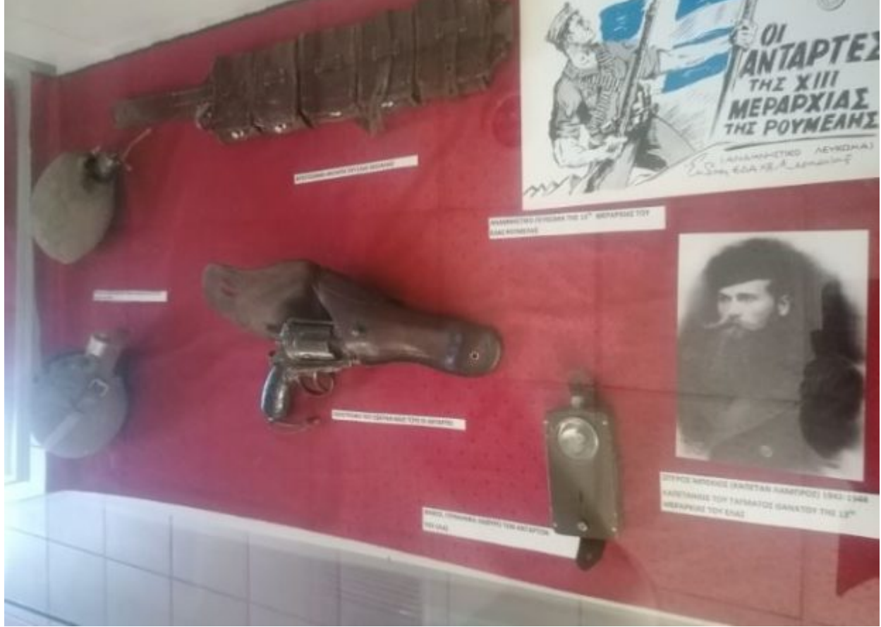
ΕΠΙΣΤΡΟΦΗ ΑΡΜΑΤΩΝ ΑΠΟ ΤΟΝ ΚΑΛΑΜΑΡΙ