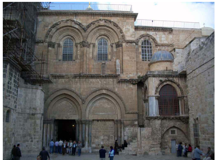
Η αυλή του ιερού ναού της Αναστάσεως στα Ιεροσόλυμα

Στο νότιο μέρος της Αγίας Αυλής, μπροστά από τον Πανιέρο Ναό της Αναστάσεως, βρίσκεται μικρή μονή που είναι μετόχι της μονής της Κοιμήσεως της Θεοτόκου, όπου και το θεομητορικό μνήμα, η οποία υπάρχει στη Γεθσημανή. Εδώ κατά παράδοση διαμένει ο κατά καιρόν ηγούμενος της Γεθσημανή. Εδώ επίσης φυλάσσεται μία ολόσωμη, περίτεχνη και επάργυρη εικόνα της Θεοτόκου, που την παραμονή της εορτής της Κοιμήσεως της Θεοτόκου, στις 14 Αυγούστου, μεταφέρεται με μεγαλοπρεπή εκκλησιαστική πομπή και παράταξη στο ναό της Κοιμήσεως, στη Γεθσημανή, όπου και φάλλονται τα εγκώμια για την Κοίμηση της Θεοτόκου και εκφωνείται ειδικός επιτάφιος λόγος, κατά την ακολουθία του «Επιταφίου της Παναγίας», που τελείται μαζί με τον εσπερινό της παραμονής. Η εικόνα μεταφέρεται και πάλι στο Μετόχι κατά την απόδοση της εορτής της Κοιμήσεως της Θεοτόκου, στις 23 Αυγούστου.