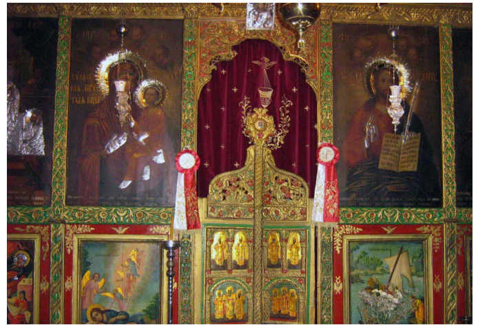
Το τέμπλο της Ι. Μονής της Θεοτόκου «Σείδανάγια» στα Ιεροσόλυμα

Σε μικρή απόσταση από τον Πανίερο Ναό της Αναστάσεως υπάρχει η γυναικεία μονή της Υπεραγίας Θεοτόκου, η λεγόμενη «Σείδανάγια» (δηλ. Αγία Δέσποινα).