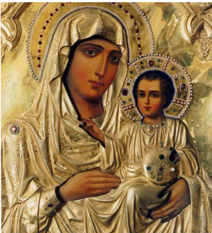
Παναγία η Ιεροσολυμίτισσα

Η Παναγία αποτελεί το πλέον αγαπητό ιερό πρόσωπο στην ελληνική θρησκευτική λαογραφία. Το φανερώνουν αυτό τόσο οι πολλές θεομητορικές εορτές στον ετήσιο εορτολογικό μας κύκλο, όσο και τα πολλά και ποικίλα έθιμα που σχετίζονται με αυτές. Παραλλήλως, πολλά είναι τα προσκυνήματα των Αγίων Τόπων που σχετίζονται με την επί γης ζωή της Θεοτόκου, τα οποία ανά τους αιώνες αποτέλεσαν σταθμούς της προσκυνηματικής θεωρίας στην Αγία Γη. Καθώς μάλιστα το προσκύνημα αυτό συχνά διαμόρφωνε και προσδιόριζε τις εκφάνσεις της λαϊκής θρησκευτικότητας, η αναφορά στα προσκυνήματα αυτά νομίζω ότι είναι ιδιαίτερος ενδιαφέρουσα για τη σπουδή της θέσης της Θεοτόκου στην ελληνορθόδοξη θρησκευτική λαογραφία.