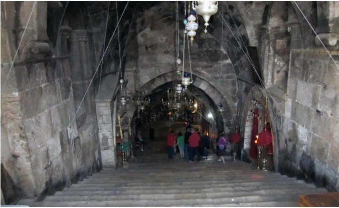
Ο τάφος της Θεοτόκου στην Γεθσημανή

Ιησούς Χριστός. Στο χώρο όπου κατά την παράδοση η Θεοτόκος δέχθηκε το μήνυμα του Ευαγγελισμού χτίστηκε ναός ήδη από τα πρώτα χριστιανικά χρόνια. Μετά την καταστροφή του κατά την διάρκεια της περσικής επιδρομής εναντίων των Αγίων Τόπων, το 614, πάνω στα ερείπιά του χτίστηκε τρίχωρος τοιχογραφημένος ναός της βυζαντινής περιόδου. Στη βόρεια πλευρά του σωζόμενου σήμερα ναού, που αποτελεί συνέχεια των ναών που προαναφέρθηκαν, υπάρχει το παρεκκλήσιο του Ευαγγελισμού, κάτω από την Αγία Τράπεζα του οποίου αναβλύζει πηγή, της οποίας το δροσερό νερό θεωρείται θαυματουργό αγίασμα. Πρόκειται για την λεγόμενη «πηγή της Παρθένου», όπου κατά την παράδοση έλαβε χώρα ο Ευαγγελισμός της Θεοτόκου.