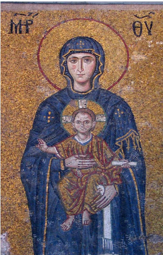
Οι απαρχές της χρήσης του τίτλου Θεοτόκος για την Παρθένο Μαρία

Είναι αναμφισβήτητο ότι το πρόσωπο της Μητέρας του Κυρίου, της Θεοτόκου και Αειπάρθενου Μαρίας, κατέχει στην ορθόδοξη εκκλησιαστική συνείδηση μια περίοπτη και ξεχωριστή θέση, η οποία πηγάζει από την πλήρη και ορθή κατανόηση της εκκλησιαστικής παράδοσης, όπως αυτή ερμηνεύθηκε μέσα από τις μαρτυρίες της Αγίας Γραφής και των Πατέρων και εκκλησιαστικών συγγραφέων των πρώτων κιόλας χριστιανικών αιώνων και όπως εκφράστηκε μέσα από τις αποφάσεις των Οικουμενικών Συνόδων.