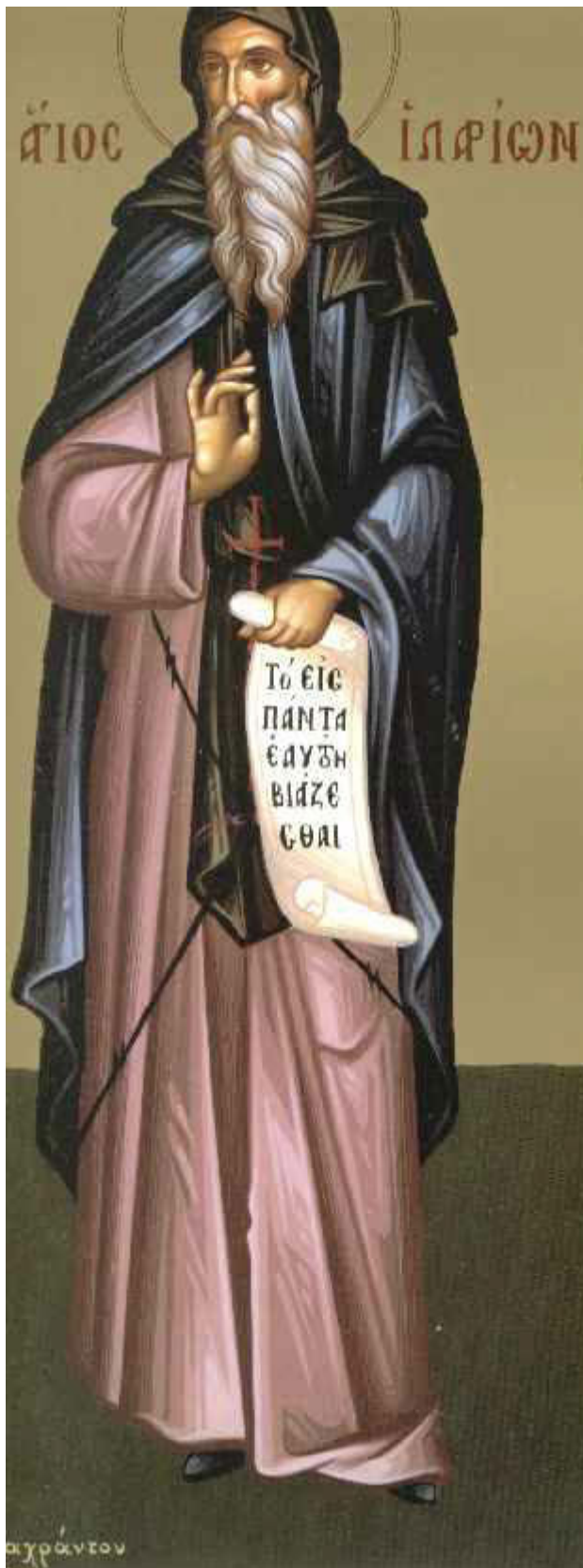
Ἅγιος Ἰλαρίων ὁ νέος, ἡγούμενος Μονῆς Δαλμάτων