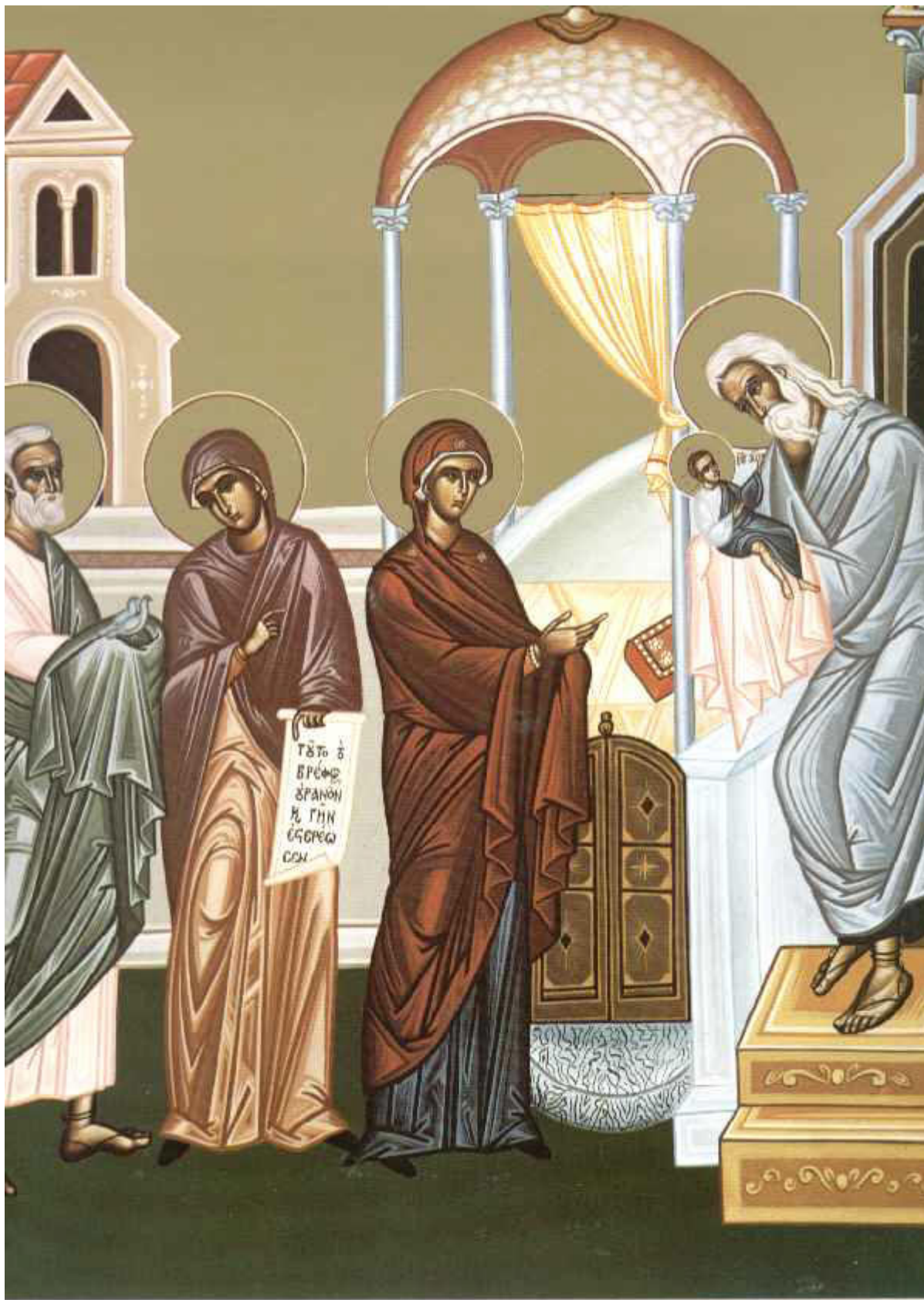
Η Υπαπαντή του Κυρίου