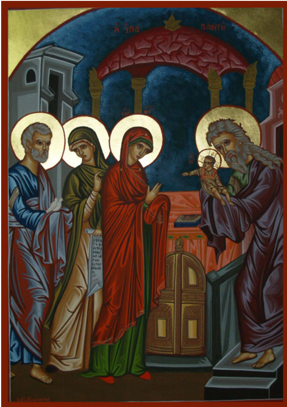
Ἡ Υπαπαντή του Κυρίου - Λυδία Γουριώτη© ( http://lydiagourioti-iconography.blogspot.com )

Ορθοδοξία και Ορθοπραξία / Συναξαριακές Μορφές