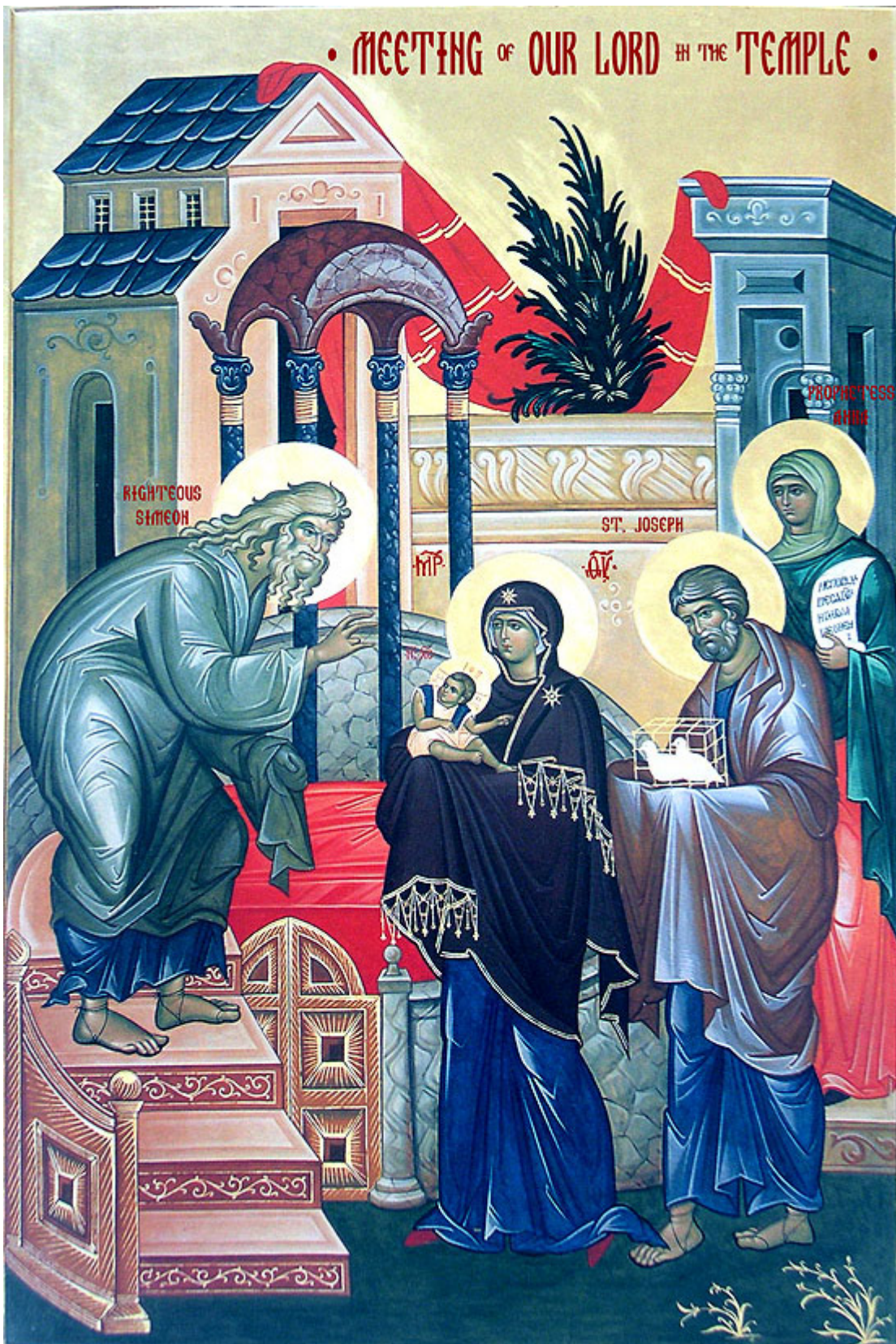
Η Υπαπαντή του Κυρίου