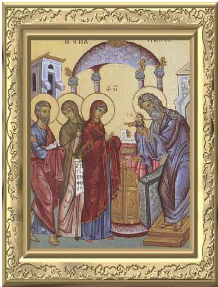
Η Υπαπαντή του Κυρίου