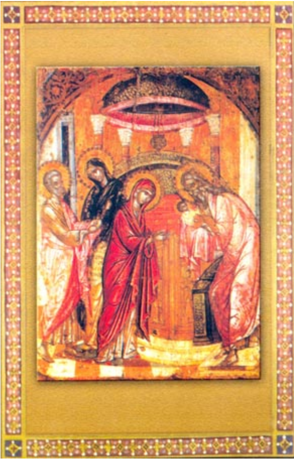
Η Υπαπαντή του Κυρίου