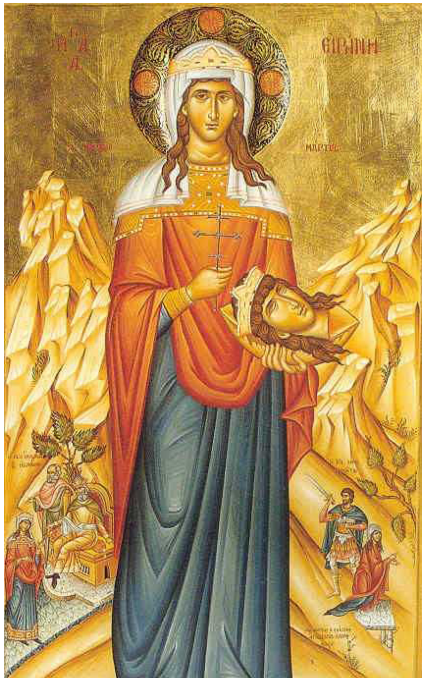
Αγία Ειρήνη η Μεγαλομάρτυς