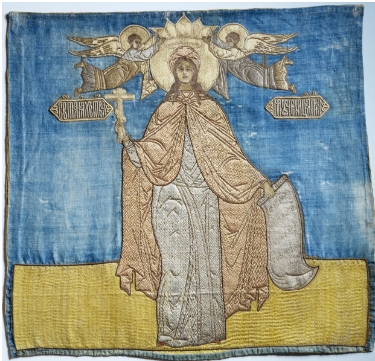
Αγία Ειρήνη η Μεγαλομάρτυς - Ρωσική κεντημένη εικόνα, 1598 - 1604 μ.Χ.