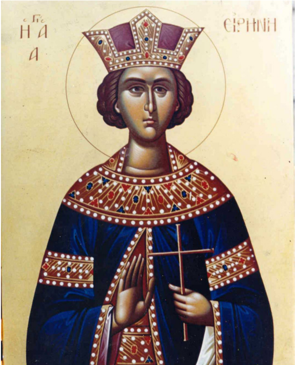
Αγία Ειρήνη η Μεγαλομάρτυς