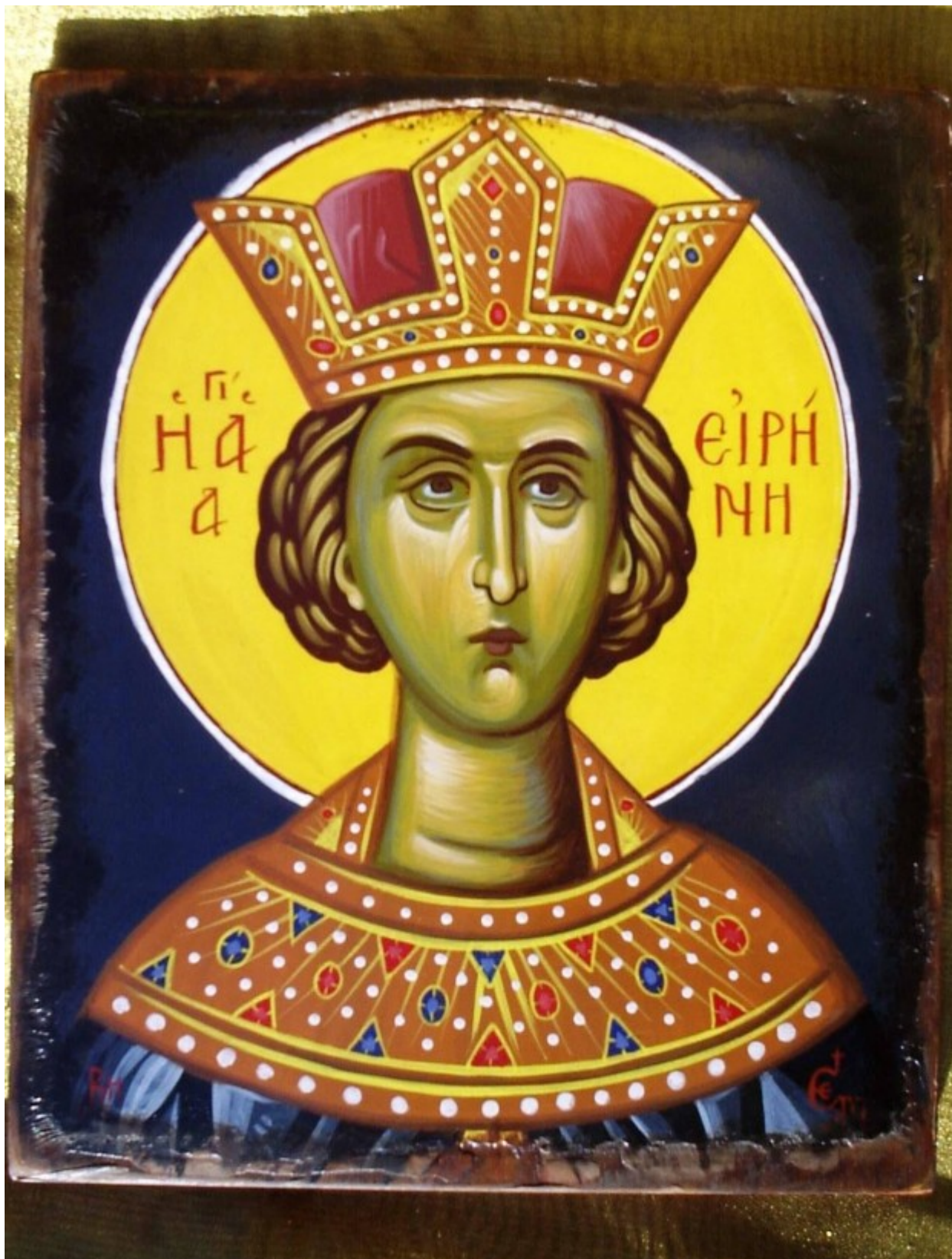
Αγία Ειρήνη η Μεγαλομάρτυς - Χρωστήρας© ( xrostiras.blogspot.com )