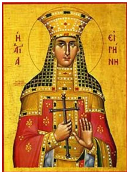
Αγία Ειρήνη η Μεγαλομάρτυς