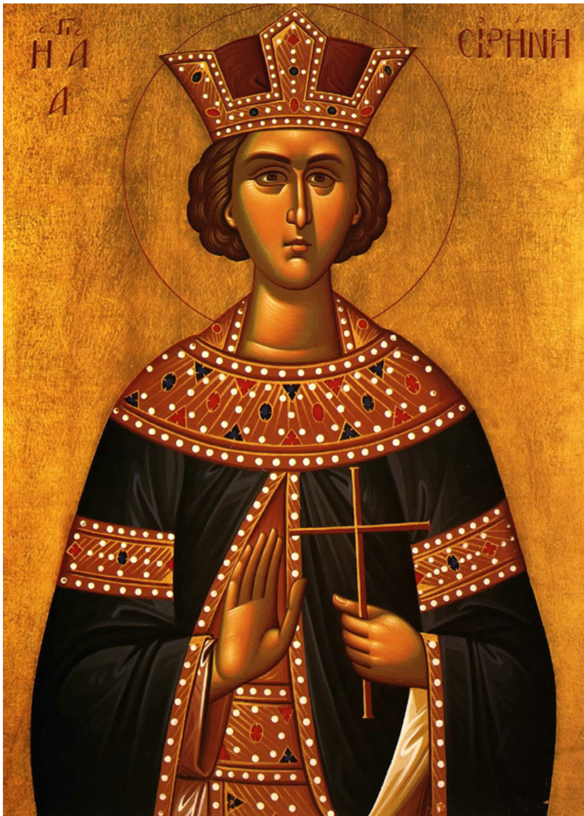
Αγία Ειρήνη η Μεγαλομάρτυς