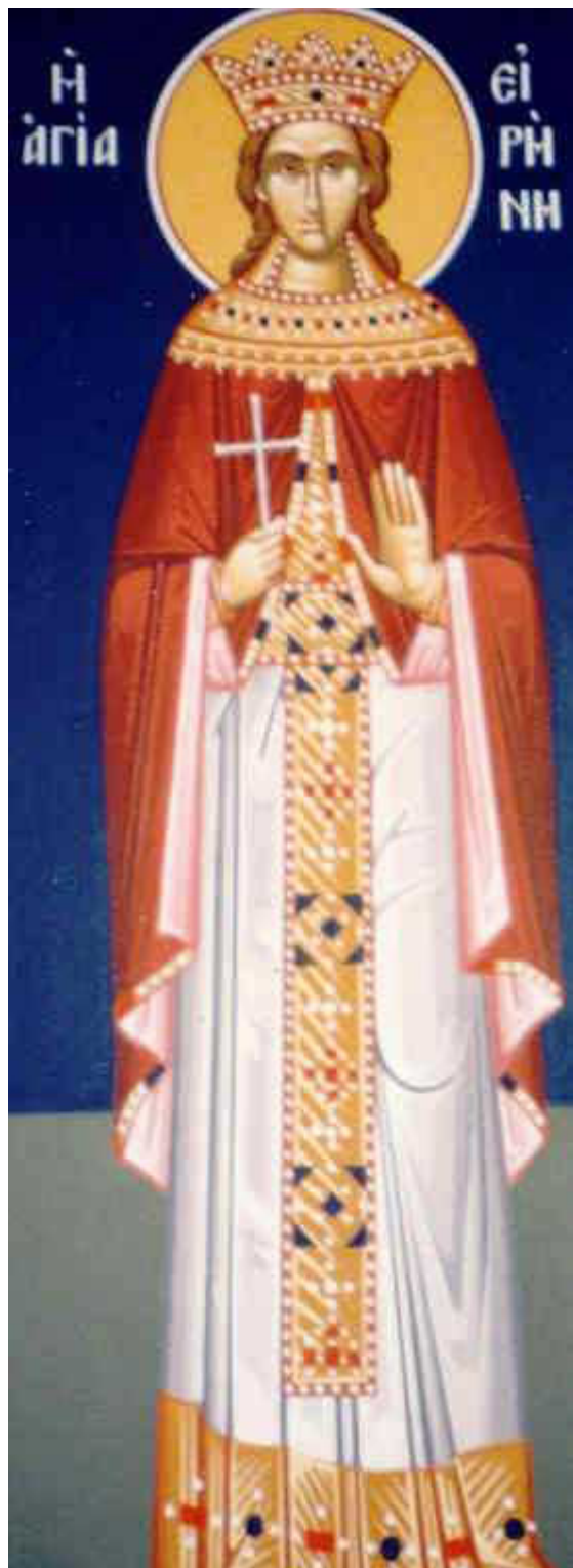
Αγία Ειρήνη η Μεγαλομάρτυς