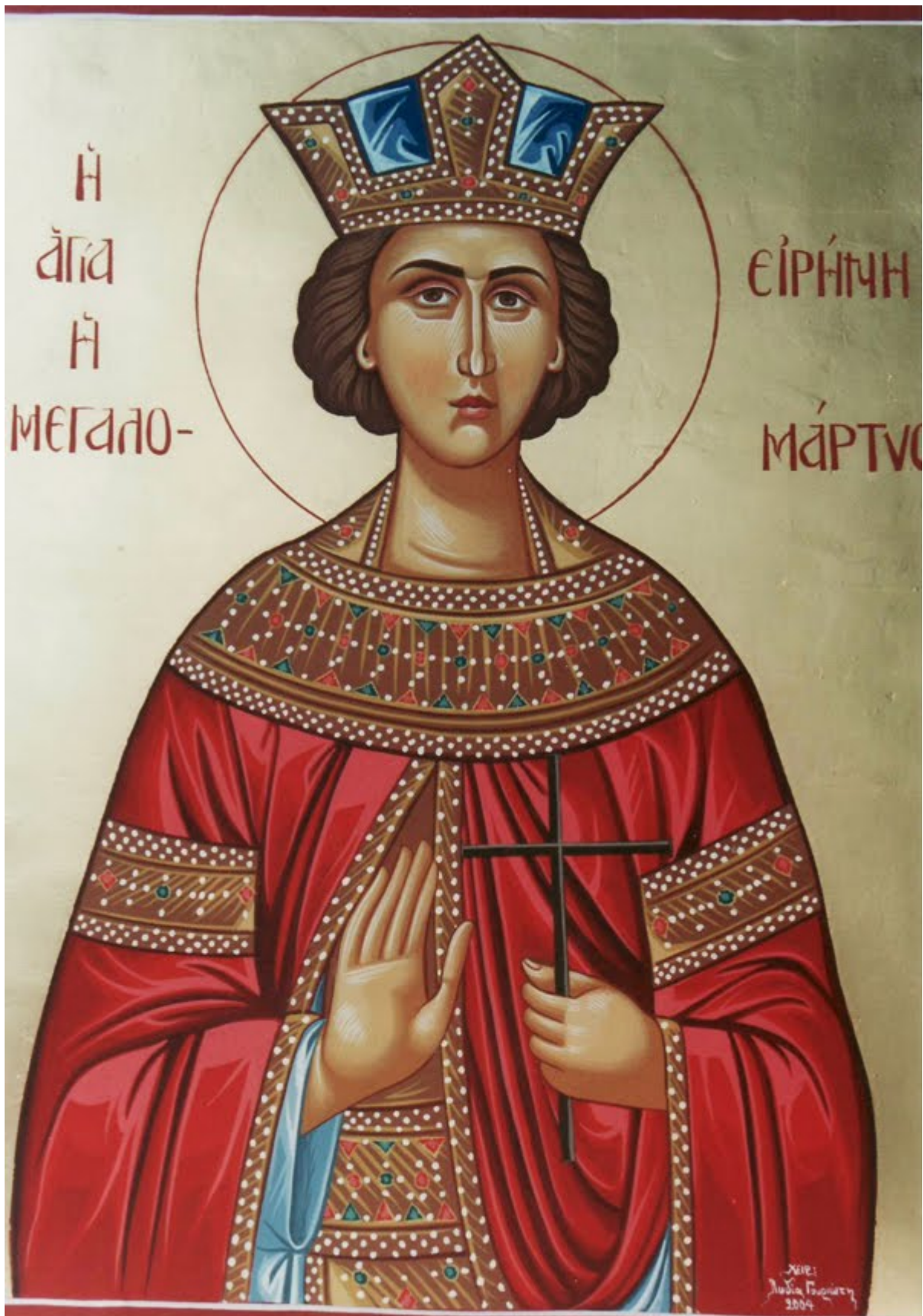
Αγία Ειρήνη η Μεγαλομάρτυς - Λυδία Γουριώτη© ( lydiagourioti-iconography.blogspot.com )