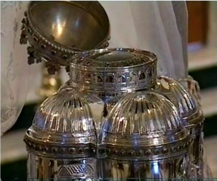
Η τίμια κάρα της Αγίας Ειρήνης της Μεγαλομάρτυρος