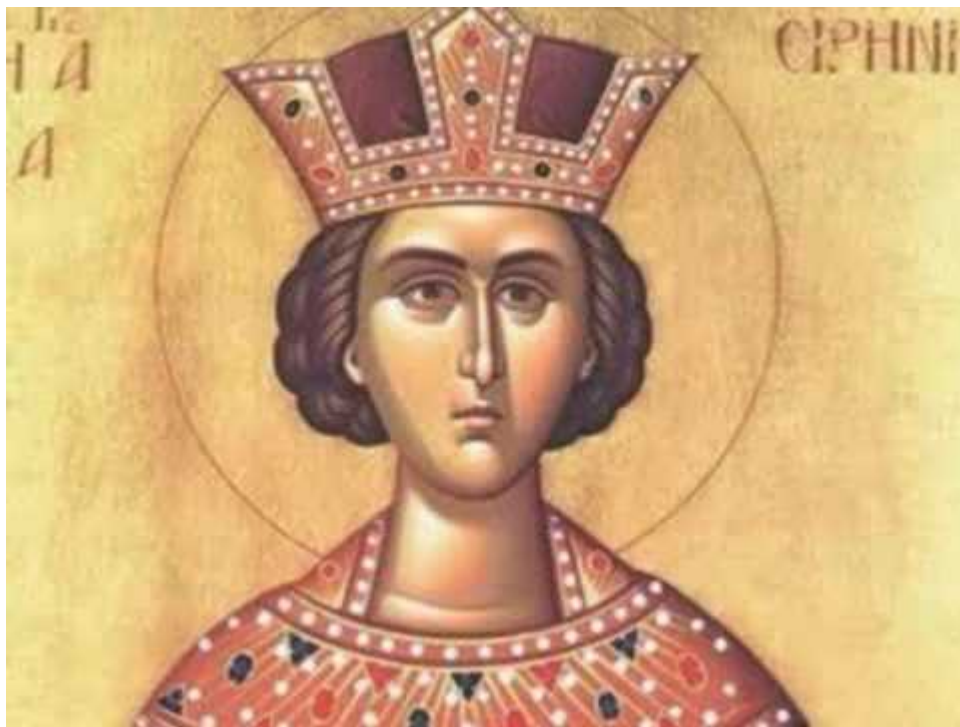
Αγία Ειρήνη η Μεγαλομάρτυς