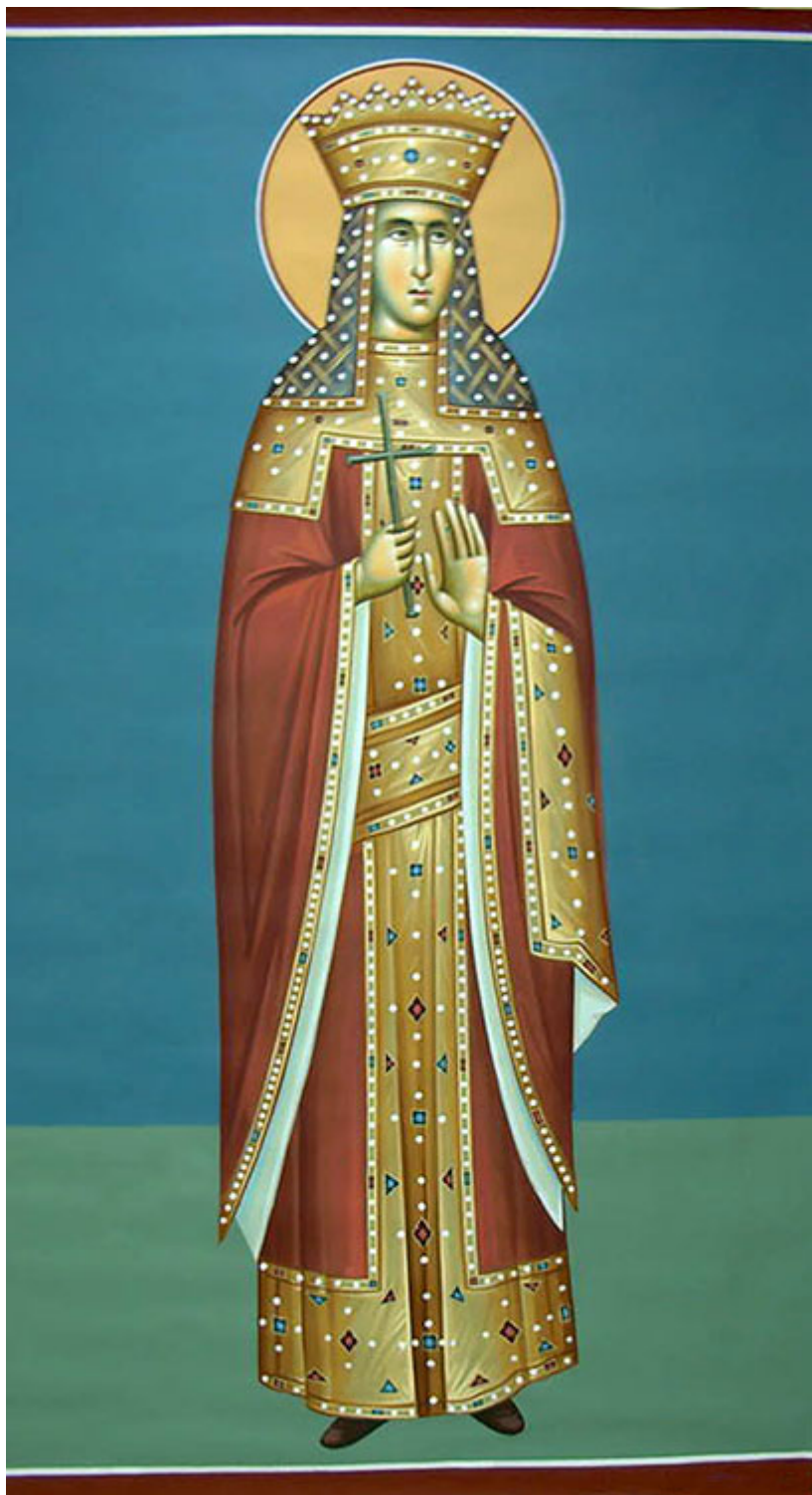
Αγία Ειρήνη η Μεγαλομάρτυς