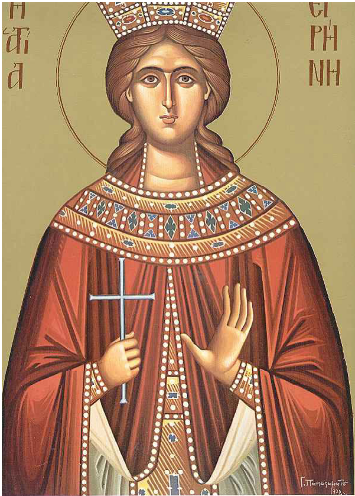
Αγία Ειρήνη η Μεγαλομάρτυς