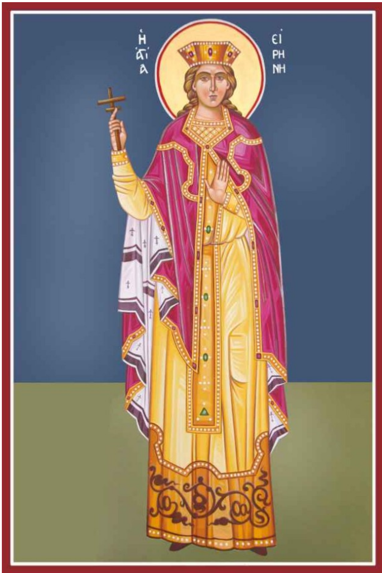
Αγία Ειρήνη η Μεγαλομάρτυς - Καζακίδου Μαρία© ( byzantineartkazakidou.blogspot.com )