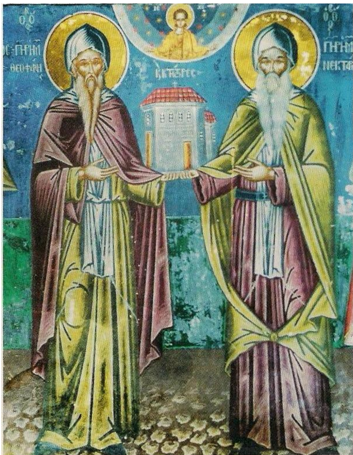
Οἱ ὄσιοι Θεοφάνης καὶ Νεκτάριος. Τοιχογραφία Ἰ. Μ. Βαρλαάμ Μετεώρων (16ος αἰ.).