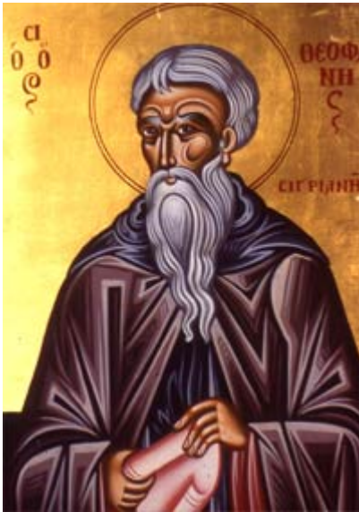
Όσιος Θεοφάνης ο Ομολογητής της Συγριανής