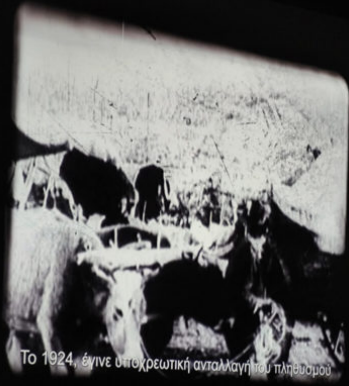
Το 1924, έγινε υποχρεωτική ανταλλαγή του πληθυσμού